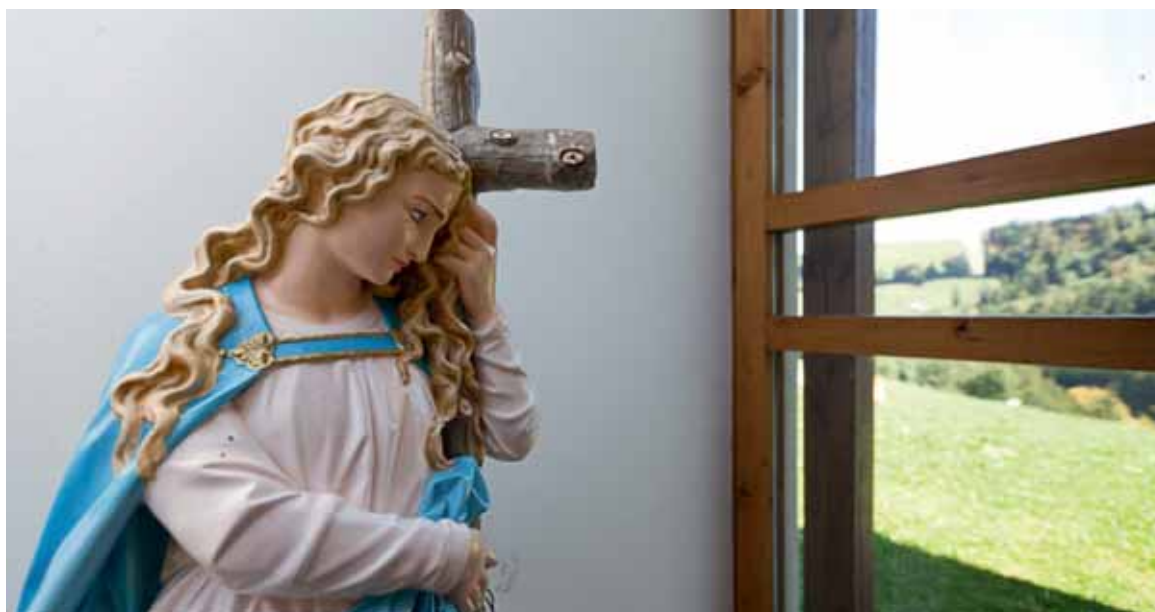
Statue der heiligen Maria Magdalena in der Kapelle von Les Allières.

Aber die Fragen, die sich in Bezug auf die christliche Identität stellen, sind nicht länger nur Sache der Kirchen und entziehen sich teilweise deren Kontrolle. Die Abstimmung über die Minarettinitiative im Jahr 2009 war nicht wirklich Ausdruck starker christlicher Überzeugungen 141 : Dagegen beriefen sich jene, die ein Minarettverbot verlangten, auf die christliche Kultur 142 . Dies stärkt die These, die die Schweizerische Vereinigung für Zukunftsforschung, SwissFuture, in ihren Szenarien zum Wertewandel in der Schweiz bis 2030 formulierte: Gemäss ihrer Analyse ist es sehr unwahrscheinlich, dass die Religion als kollektive und umfassende Kraft in die westlichen Gesellschaften zurückkehrt; möglich ist jedoch, dass religiöse Bezüge vermehrt als Deutungsmuster verwendet werden, dies insbesondere um die Identität einer Gesellschaft (in Abgrenzung zu anderen Kulturen) zu bekräftigen 143 .