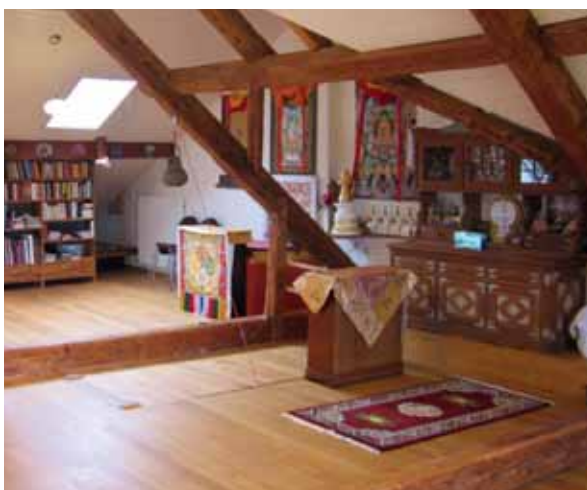
Bei einem Buddhisten, der den tibetischen Buddhismus praktiziert, im Kanton Freiburg (© 2011 Pierre Köstinger).

Kürzlich durchgeführte Umfragen haben einmal mehr gezeigt, dass die Schweizer ein positives Bild des Buddhismus haben und ein Interesse da ist für gewisse Formen, insbesondere für den tibetischen Buddhismus 36 . Das Bild, das der Dalai Lama in den Medien abgibt, trägt sicher das Seine dazu bei. Die Vorträge, die von buddhistischen Gruppen in Freiburg organisiert wurden, zogen viel mehr Leute an als nur die wenigen praktizierenden Buddhisten.