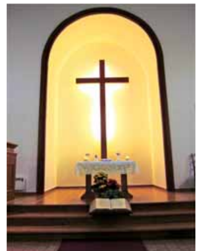
In der reformierten Kirche Bulle, vor einem Gottesdienst am Sonntagabend.

Gemäss unseren muslimischen Gesprächspartnern sind maximal 20% der Muslime mehr oder weniger regelmässig in der Moschee und somit regelmässig oder gelegentlich praktizierend (die wöchentliche Praxis ist viel schwächer). Dies scheint uns realistisch zu sein und deckt sich mit Beobachtungen aus anderen Kantonen. Da statistische Angaben und entsprechende Messinstrumente fehlen, kann man hier nichts Genaueres aussagen.