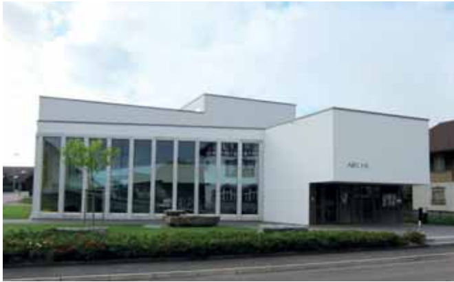
Das neue Zentrum der reformierten Kirche in Bösing.

Ganz anders sieht die Situation bei den übrigen religiösen Gemeinschaften aus. Nur die Gebetsräume der neapostolischen Kirche in Freiburg und Murten sowie der neue, sehr moderne (Mehrzweck-)Saal der Freien Evangelischen Gemeinde Murten wurden spezifisch für die Ausübung der entsprechenden Religion gebaut. Alle anderen Gemeinschaften mussten ihre Gebetsräume in Gebäuden einrichten, die zu einem anderen Zweck errichtet worden waren. Die orthodoxe Gemeinde Freiburgs konnte eine frühere Kapelle katholischer Nonnen mieten.