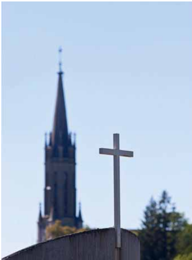
Im Vordergrund das Kreuz, welches das reformierte Zentrum von Châtel-Saint-Denis überragt; im Hintergrund der Kirchturm der katholischen Kirche.

In der Praxis funktioniert die Zusammenarbeit gut. «Wir werden von den Katholiken gut aufgenommen», berichtet ein reformierter Pfarrer. Dort, wo es keine reformierte Kirche gibt, «stellen uns die Katholiken für Beerdigungen ihre Infrastruktur gerne zur Verfügung». Auch die Orthodoxen loben die positive Art, mit der solche Anfragen von den katholischen Pfarreien aufgenommen werden.