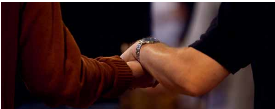
Während einer katholischen Liturgiefeyer.

Mönchsklöster könnte Ähnliches berichtet werden. Ein Bereich, der zu Besorgnis Anlass gibt, ist die Alterung, von der auch viele Ordenshäuser betroffen sind. Die Zahl der Mönche und Nonnen nimmt ab, daher muss damit gerechnet werden, dass gewisse dieser Häuser früher oder später ihre Tore schliessen müssen. Es gab auch Neuansiedlungen, so zum Beispiel das Couvent des Carmes, das aus einer Gruppe von Mönchen entstanden ist, die im Jahr 1975 zum Studium an die Universität Freiburg gekommen waren.