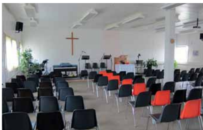
Der Kultusraum der Église évangélique libre im Schönberg.

Einige Gemeinschaften haben kein ständiges Lokal: Die eritreisch-orthodoxe Gemeinde, an deren Gottesdienst jeden Sonntag mehrere Dutzend Gläubige teilnehmen, geniesst wie bereits erwähnt das Gastrecht der katholischen Kapelle von Villars-Vert, doch müssen die Eritreerinnen und Eritreer um 10 Uhr draussen sein, weil dann die Messe gehalten wird. Wie in jeder Minderheitsgemeinschaft schätzen die Gläubigen das gesellige Beisammensein nach dem Gottesdienst. Da sie keinen Raum haben, wo sie gemeinsam Tee trinken können, bleibt ihnen nur der Aufenthalt im Freien, was im Winter mit Wind und Kälte verbunden ist. Solche Treffen sind aber wichtig für eine Diasporagemeinde: Sie tragen zur Integration bei und erlauben es gleichzeitig, die eigene Kultur zu pflegen. Die ideale Lösung ist ein Lokal mit einem Gebetsraum und einem Versammlungsraum für den Austausch nach dem Gottesdienst. Falls die Kirchen der etablierten Religionsgemeinschaften nicht oder zu wenig genutzt werden, wäre zu überlegen, ob sie unter Berücksichtigung der finanziellen Implikationen (Unterhaltskosten usw.) den christlichen Migrationskirchen zur Verfügung gestellt werden könnten.