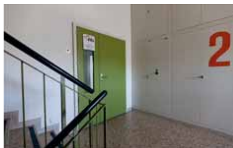
Eingang zu den Räumlichkeiten der Église évangélique libre im zweiten Stock eines Gebäudes im Schönberg.