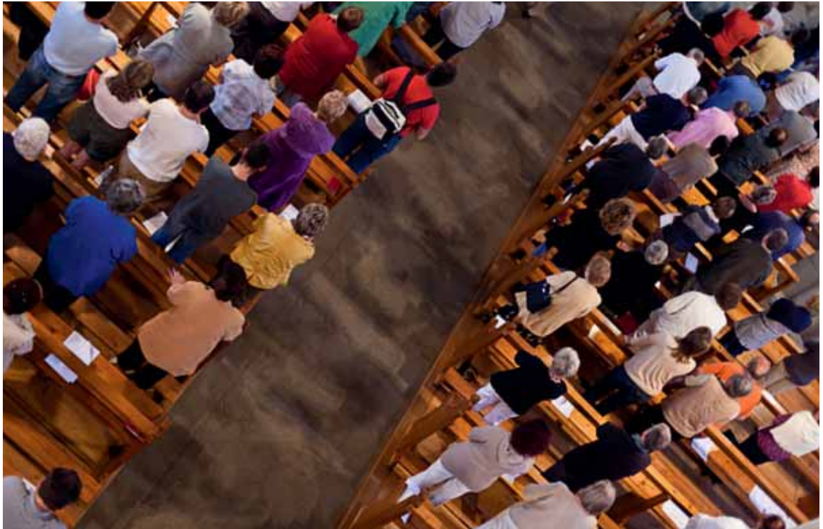
Eine Votivmesse in der Kirche Farvagny.

Ebenfalls zu erwähnen sind die 5 Sprachmissionen, namentlich für Bevölkerungsgruppen aus Südeuropa 8 . Im Kanton leben rund 18 000 Personen portugiesischer Herkunft 9 , 3500 italienischer Herkunft, 2000 spanischer Herkunft und 2000 bis 3000 spanischsprachige aus Lateinamerika. Die katholischen Portugiesen machen schon allein rund 10% der katholischen Bevölkerung des Kantons aus. Diese lebendigen Gemeinden profitieren von der Infrastruktur, die ihnen von den Pfarreien zur Verfügung gestellt wird.