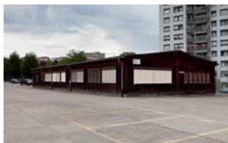
Kultusraum der Église évangélique de réveil im Freiburger Beaumontquartier (© 2011 Nicolas Brodard).