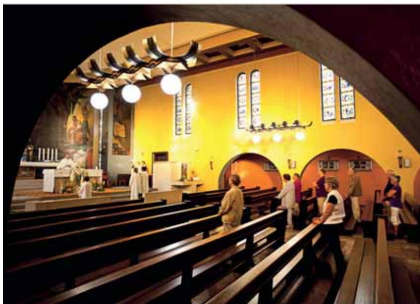
Messe an Mariä Himmelfahrt in Murist.

Ein katholischer Priester fasst es so zusammen: «Von Sonntag zu Sonntag hat die Zahl der Praktizierenden abgenommen». Die Pfarrkirche spielt sozial nicht mehr dieselbe Rolle. Sie ist nicht mehr der Ort, wo man nach der Messe Freunde trifft und gemeinsam ins Dorfcafé geht.