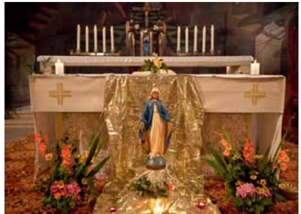
Statue der Jungfrau Maria vor dem Altar der Kirche in Murist, 15. August.

Auf reformierter Seite ist bei den Taufen in den letzten Jahren ein leichter Rückgang zu verzeichnen. Man wird jedoch erst in einigen Jahren sehen, ob wir es hier mit einer Tendenz zu tun haben oder nur mit jährlichen Schwankungen, die auf die demographische Situation zurückzuführen sind. Die Zahl der Konfirmationen scheint seit 2008 zurückzugehen: von 404 auf 316 im Jahr 2010. Auch hier wird man einige Jahre warten müssen, um zu sehen, ob sich diese Tendenz bestätigt, oder ob es sich um eine vorübergehende Fluktuation handelt.