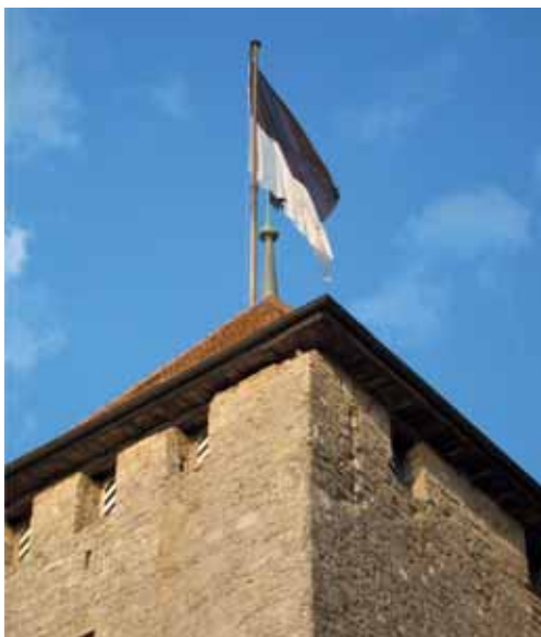
Freiburger Fahne über Murten.

In der Bundesverfassung steht: «Für die Regelung des Verhältnisses zwischen Kirche und Staat sind die Kantone zuständig» (Art. 72 Abs. 1). Dem Kanton Freiburg kommt also die Aufgabe zu, den rechtlichen Rahmen für die auf seinem Gebiet ansässigen Religionsgemeinschaften festzulegen oder anzupassen. Religion ist nämlich nicht nur eine Frage individueller Ansichten oder Überzeugungen: Diese werden in Gemeinschaften gepflegt, die eine Rolle in der Gesellschaft spielen können – sofern der Staat nicht versucht, ihre Tätigkeit auf den privaten Raum zu beschränken.