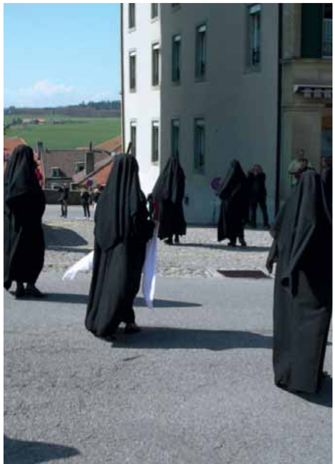
Fronleichnamsprozession in Freiburg (26. Mai 2005) und Klageweiber von Romont (Karfreitag 2009).