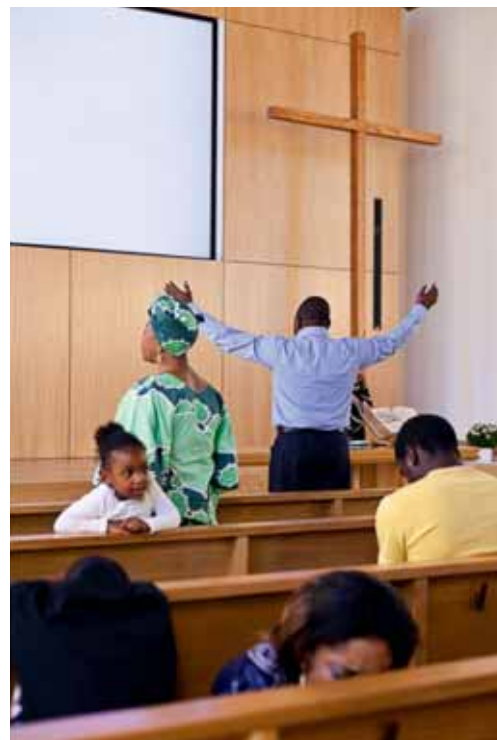
Gottesdienst in der Église du Christ, Freiburg (© 2011 Nicolas Brodard).

Die soziologischen Überlegungen zur Zukunft der grossen religiösen Institutionen des Westens berücksichtigen sowohl die Hypothese eines raschen Bedeutungsverlusts als auch die eines allmählichen Rückgangs – ohne die Möglichkeiten zur Eindämmung dieser Entwicklung ausser Acht zu lassen. Verschiedene Autoren sind der Ansicht, dass etablierte Religionsformen vom bisher Erreichten zehren: Je länger die Verbundenheit abnimmt (die alten Generationen sterben, die Mehrheit der Jungen wendet sich vom traditionellen religiösen Rahmen ab), desto mehr werden diese Religionsgruppen nur noch eine Minderheit der Bevölkerung vertreten 122 . Andere Autoren weisen auf die Rolle der religiösen Institutionen für die Begehung von jährlichen Festen (z. B. Weihnachten) und von Übergangsriten hin, ohne die sinkende Verbundenheit mit den traditionellen religiösen Institutionen zu verschweigen. Aus diesem Grund verläuft die Erosion langsam: