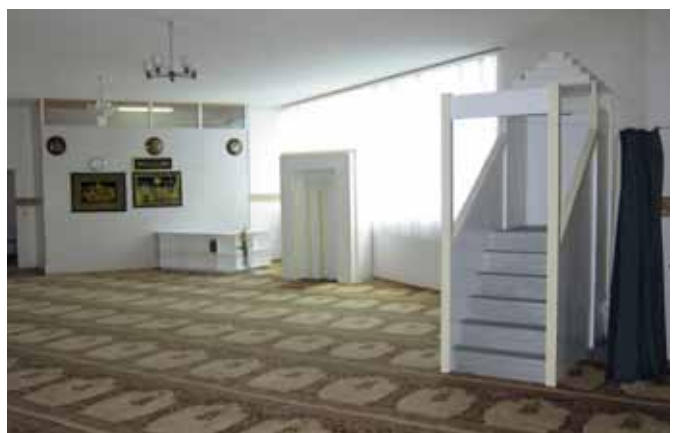
In der Moschee in Murten (© 2011 J.-F. Mayer).

In der Region Murten stammt die überwiegende Mehrheit der Muslime aus den Ländern Ex-Jugoslaviens. Das Islamische Kulturzentrum von Murten wurde 1998 auf Initiative von 15 bis 20 Familien eröffnet. Zuerst mieteten sie einfach einen Raum für den Ramadan, beschlossen dann aber, dass es praktisch wäre, einen ständigen Gebetsraum vor Ort zu haben, um nicht nach Bern oder Freiburg reisen zu müssen. Der Gebetsraum wurde zuoberst in einem alten Industriegebäude in der Nähe des Bahnhofs hergerichtet.