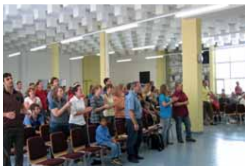
Freie Evangelische Gemeinde, Düdingen (© 2011 J.-F. Mayer).

Die Gruppe mit dem Namen Espace Rencontre ( www.espacerencontre.ch ) hiess zuerst Église évangélique libre de Villars-sur-Glâne . Sie entstand Ende der 1990er-Jahre als Gemeindegründungsprojekt in Freiburg und ist Mitglied der Fédération romande d'Églises évangéliques (FREE). Seit Mitte Oktober 2011 trifft sich die Gruppe in neuen Räumlichkeiten in Bourguillon. Gegenwärtig gehören etwa dreissig erwachsene Mitglieder und 20 bis 30 Kinder zur Gemeinschaft.