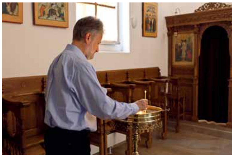
Orthodoxe Kapelle in Freiburg (© 2011 Nicolas Brodard – www.nicolasbrodard.com ).

Zahlreiche serbisch-orthodoxe und rumänisch-orthodoxe Gläubige suchen eher die Gebetsräume ihres jeweiligen Patriarchen auf. Mehrere Dutzend Gläubige, vor allem rumänischer Herkunft, nehmen an den Gottesdiensten in rumänischer Sprache der Kirchgemeinde des Heiligen Demetrios der Neue Basarabov in der Kapelle des Albertinums in Freiburg teil. In dieser Kapelle finden von Zeit zu Zeit auch Gottesdienste in serbischer Sprache statt. Im Kanton Freiburg wohnhafte serbisch-orthodoxe Gläubige gehen in die serbische Kirche in Belp (BE), deren Kirchgemeinde auch den Kanton Freiburg abdeckt ( www.spcobern.ch ).