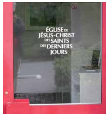
Der Eingang zu den Räumlichkeiten der Kirche Jesu Christi der Heiligen der Letzten Tage («Mormonen») in Les Daillettes, Freiburg.

Schon seit längerem begegnet man in Freiburgs Strassen jungen Missionaren der Mormonen. Häufig stammen sie aus Amerika. Ab Ende der 1970er-Jahre fanden Treffen mit einigen Personen aus der Gegend statt, die sonst nach Yverdon oder Neuenburg gingen. Ab 1990 wurden regelmässige Versammlungen organisiert, zuerst in gemieteten Hotelräumlichkeiten. Am 2. Februar 1992 wurde dann schliesslich in Freiburg ein Zweig der Kirche Jesu Christi der Heiligen der Letzten Tage gegründet («Mormonen» ist nicht die offizielle Bezeichnung). Knapp dreissig Personen waren anwesend, darunter einige wenige Freiburger. Etwas später zog die Gruppe in den Raum in Les Daillettes um, den sie seither für ihre Anlässe benützt. Heute besteht die Gemeinschaft in Freiburg aus ungefähr 160 Mitgliedern. Mehr als 60 von ihnen nehmen an den Abendmahlsversammlungen teil und können daher als engagierte Gläubige betrachtet werden. Kürzlich sind mehrere Familien aus anderen Kantonen zugezogen, dies könnte der Gruppe und ihren Aktivitäten neuen Schwung verleihen.