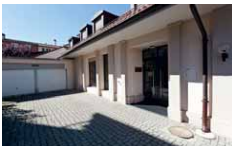
Eingang zur Kapelle der Siebentags-Adventisten im Altquartier.