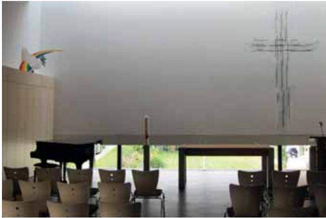
Der Gottesdienstraum der reformierten Kirche in Bösinggen aus dem Jahr 2008.

Der Sensebezirk ist der zweite Bezirk mit vielen Reformierten, da im 19. Jh. Berner Bauern hierher kamen (bis in die 1940er-Jahre war der Kauf von Bauernhöfen einfach). Die Kirchgemeinden sind Bösinggen (1128 Mitglieder) 17 , Düdingen (1255), St. Antoni (2031), Weissenstein-Rechthalten (1097) und Wünnewil-Flamatt-Überstorf (2272). Für lange Zeit (von 1867 bis 1998) vereinte eine einzige Kirchgemeinde mit Zentrum in St. Antoni (Kirche 1866 eingeweiht) alle Reformierten des Bezirks. Neue reformierte Gläubige, hauptsächlich bernischen Ursprungs, gesellten sich zu der bestehenden Bevölkerung.