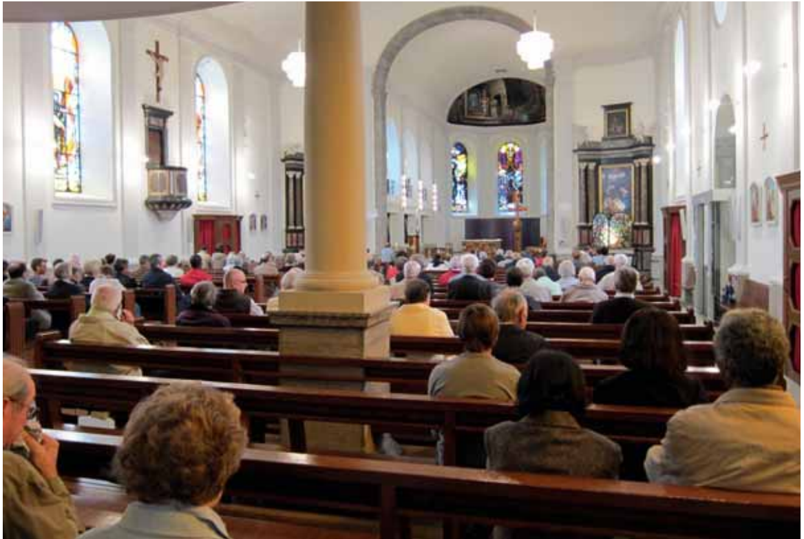
An einem Sonntagmorgen in der katholischen Kirche von Bulle.

Für die Katholiken stimmen die verschiedenen Schätzungen darin überein, dass die regelmässige (nicht unbedingt wöchentliche) Teilnahme an der Sonntagsmesse wahrscheinlich unter 10% liegt – je nach Pfarrei zwischen 5% und 10% 41 , wie wir aus gut informierter Quelle vernommen haben.