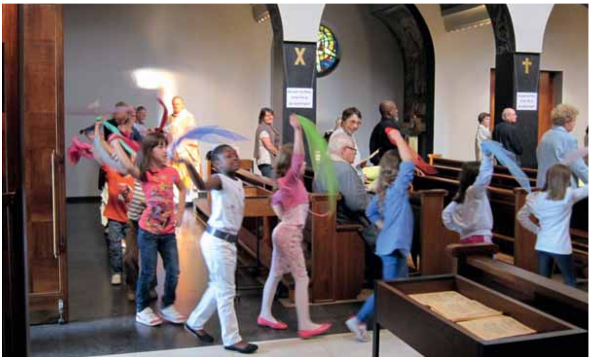
Einzugsprozession der Messe von Samstagabend 18. Juni 2011, Kirche Saint-Pierre in Freiburg (© 2011 J.-F. Mayer).

Im Sensebezirk hat der Verein Jungwacht und Blauring (JUBLA, www.jubla-freiburg.ch ) eine wichtige Rolle gespielt – und spielt sie vielleicht immer noch – was die Ausbildung von Führungskräften für die lokale Gesellschaft angeht. Hier haben diese Leute die Werte von Einsatz und Dienstbereitschaft gelernt. An einigen Orten bestehen jedoch nur noch lockere Verbindungen zur Kirche.