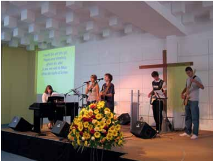
Eine Gruppe Jugendlicher beim Lobpreis in der Freien Evangelischen Gemeinde Düdingen.

Familien alle Kinder der Kirche entfremdeten». Der gleiche Pastor erzählt weiter, er habe im Jahr 2010 sechs Jugendliche getauft (in den evangelischen Freikirchen wird die Kindertaufe nicht praktiziert). Drei dieser Neugetauften kämen nicht mehr zur Kirche.