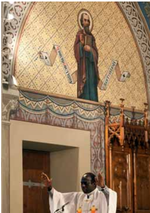
In der Kirche von Farvagny, 12. August 2011.

Eine weniger häufig erwähnte Veränderung, die jedoch nicht ohne Auswirkungen bleibt, ist das Verschwinden der Mitglieder religiöser Orden und Kongregationen, die früher an vielen Orten eine wichtige Rolle spielten (in den Schulen, den Sozialdiensten, den Wohnheimen und Spitälern).