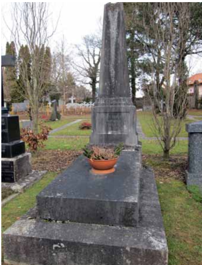
Das Grab eines 1924 gestorbenen ehemaligen Generalkontrolleurs der Finanzen des Osmanischen Reichs, der noch immer auf dem Friedhof St. Leonhard ruht, ist zweifellos das älteste muslimische Grab im Kanton.

Für andere Muslime sind die fehlenden muslimischen Grabfelder bereits ein heikles Thema, vor allem für jene, die anlässlich eines Todesfalls die Zerrissenheit erlebt haben zwischen ihren Freiburger Wurzeln und dem Wunsch, die muslimischen Regeln einzuhalten. Sie betonen, für gläubige Schweizer Muslime (Konvertiten oder Eingebürgerte) sei die Möglichkeit einer Bestattung nach islamischem Ritus in der Schweiz eine zentrale Frage, da sie keinen Grund haben, ihr Land nach dem Tod zu verlassen. Sie widerlegen die Behauptung, wonach die Forderung nach einem muslimischen Grabfeld Ausdruck von Abschottung ist: Sie sehen darin im Gegenteil die Bereitschaft, sich in die freiburgische Gesellschaft zu integrieren, auch über den Tod hinaus, aber unter Wahrung ihrer religiösen Grundsätze 110 .