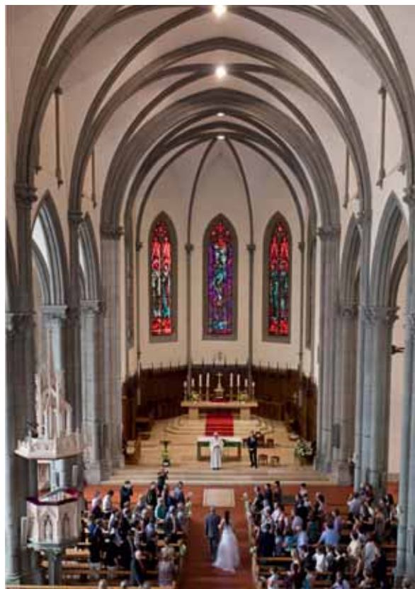
Hochzeitsfeier in der Kirche von Châtel-Saint-Denis.

In den reformierten Kirchgemeinden des Kantons gibt es verschiedene Modelle für das Feiern des Gottesdienstes. Dies hängt einerseits von den Vorlieben der betreffenden Pfarrperson ab, andererseits aber auch davon, wie in den jeweiligen lokalen Gemeinschaften auf die unterschiedlichen Erwartungen (Jugendliche, Familien usw.) eingegangen wird. Die Verwendung unterschiedlicher Liederstile zeigt diese Verschiedenheit ziemlich deutlich. Einer der Pfarrer hat auch erwähnt, dass gemäss seinen Beobachtungen viele junge Protestanten (zwischen 30 und 40 Jahren) bei Taufen oder Beerdigungen lieber andere Instrumente als die Orgel für die Begleitung der Feier wünschen. Für die Geistlichen – nicht nur die reformierten – liegt die Herausforderung darin, hier ein Gleichgewicht zwischen den unterschiedlichen Vorlieben zu finden. Dasselbe gilt für den Bereich der Liturgie, wenn Gläubige bei Übergangsriten (Taufen, Hochzeiten, Trauerfeiern) den Wunsch äussern, die Feiern gemäss ihren Vorstellungen mitzugestalten.