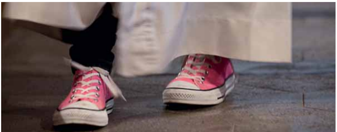
Eine Messdienerin im Einsatz.

Die «Grosskirchen» stellen alle dasselbe fest: Sobald die Jugendlichen die Adoleszenz abgeschlossen und ins Erwachsenenalter eingetreten sind, kommen die meisten von ihnen nicht mehr in die Kirche. Priester mit langjähriger Erfahrung haben den Eindruck, dass die Jugendlichen nicht mehr mit der Kirche «verbunden sind» – auch wenn sie nicht austreten. Einer der Priester denkt, dass dies auch mit der Alterung der Priesterschaft zusammenhängt. Früher habe sich in jeder Pfarrei ein junger Vikar speziell um die Jungen gekümmert und dies habe Früchte getragen.