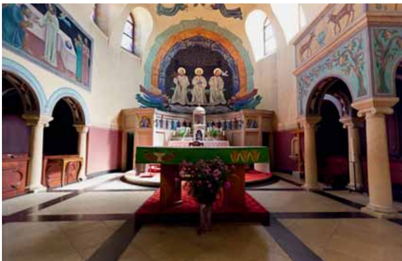
Die Kirche von Semsales.

Ebenfalls zu erwähnen sind die 5 Sprachmissionen, namentlich für Bevölkerungsgruppen aus Südeuropa 8 . Im Kanton leben rund 18 000 Personen portugiesischer Herkunft 9 , 3500 italienischer Herkunft, 2000 spanischer Herkunft und 2000 bis 3000 spanischsprachige aus Lateinamerika. Die katholischen Portugiesen machen schon allein rund 10% der katholischen Bevölkerung des Kantons aus. Diese lebendigen Gemeinden profitieren von der Infrastruktur, die ihnen von den Pfarreien zur Verfügung gestellt wird.