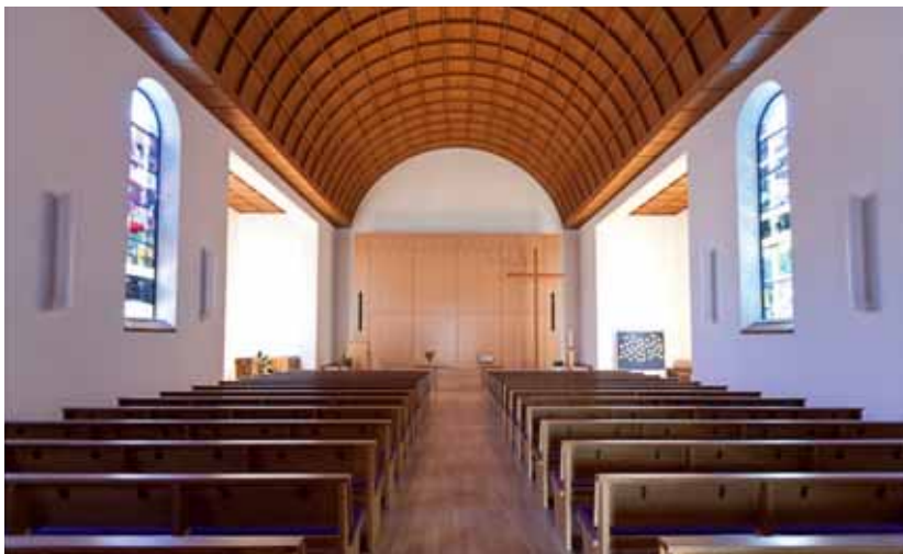
Reformierte Kirche Freiburg (© 2011 Nicolas Brodard – www.nicolasbrodard.com ).

Die Zweisprachigkeit sowie die verschiedenen Herkunftskantone der Neuankömmlinge, welche die Zahl der Protestanten erhöhen, bringen das Nebeneinander verschiedener «Traditionen» mit sich: Zwinglis Erbe hat die Deutschschweizer geprägt, dasjenige von Calvin die Romands. Reformierte sprechen eher von einer Vielzahl an Einflüssen als einer für den Kanton Freiburg spezifischen reformierten Identität.