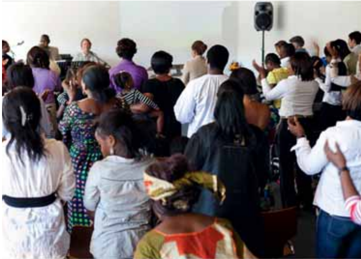
Gottesdienst der Kirche «L'Éternel Est Bon» im Industriegebiet von Moncor in Villars-sur-Glâne

und stellt ihr jeweils für den Sonntagsgottesdienst, der kurz nach Mittag beginnt, die Kirche zur Verfügung. Am Gottesdienst nehmen ungefähr fünfzig Gläubige teil, darunter viele Kinder. Die Gruppe ist Gründungsmitglied der Conférence des Églises africaines en Suisse (CEAS, www.ceasuisse.com ), die Ende der 1990er-Jahre gegründet wurde.