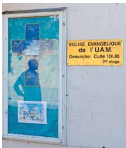
Evangelisch freikirchlicher Gebetsort in Estavayer.

Neben den evangelisch freikirchlichen Gemeinschaften, von denen eine Übersicht nach Bezirk folgt, gibt es noch einige kleinere, auf eine Familiengruppe reduzierte Gruppierungen ohne öffentliches Gotteshaus: Diese sollen im Broye- und im Sensebezirk vorkommen.