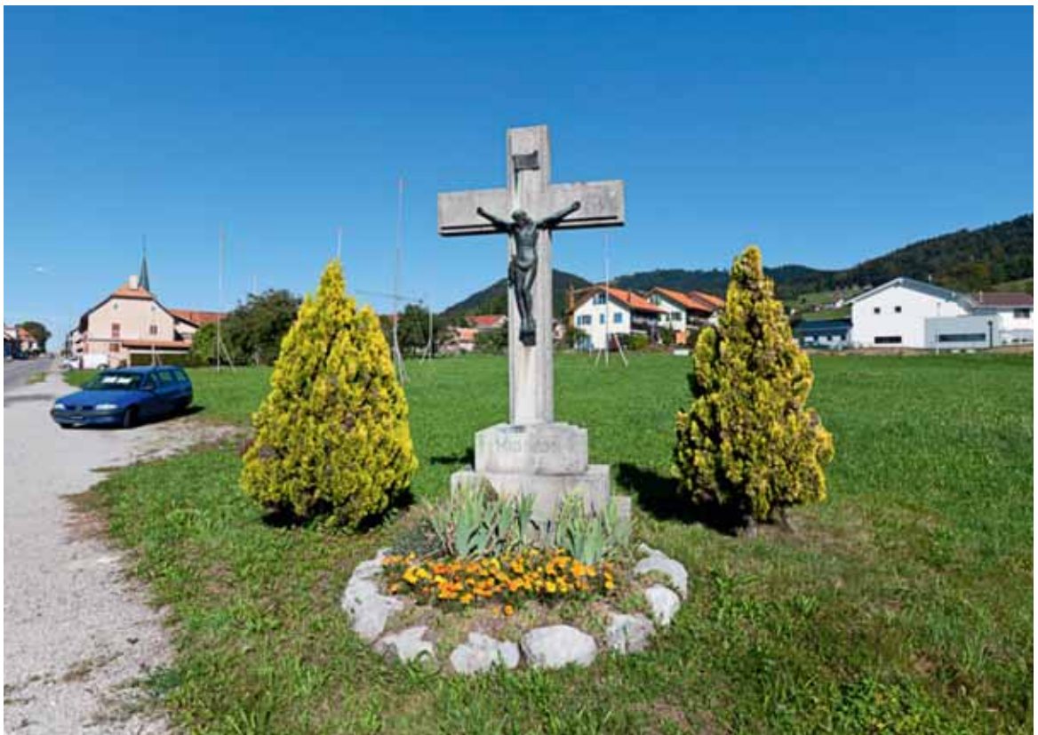
Religiöses Symbol in der Bauzone, Ausfahrt von Semsales.

Eine Reflexion über künftige Entwicklungen kann keine Voraussage sein, sondern skizziert lediglich mögliche Zukunftsszenarien gestützt auf die Analyse der bestehenden Trends und der bisherigen Entwicklungen.