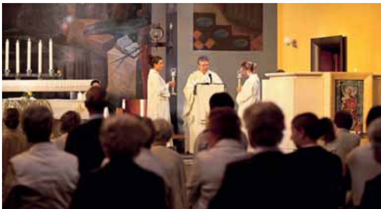
Messe in der Kirche von Murist.

Als Antwort auf diese Einwände wird betont, wie schwierig es sei, Personen zu finden, die bereit seien, Verantwortung zu übernehmen (man reisst sich nicht um den Posten als Pfarreirat). Auch wird der Aspekt der Effizienz (zur Sicherstellung einer guten administrativen und finanziellen Verwaltung 52 ) und die damit verbundenen Einsparungen erwähnt sowie die Tatsache, dass das Übertragen gewisser Aufgaben an die Seelsorgeeinheiten die Arbeitslast der Pfarreien vermindert hat 53 . Die Befürchtungen eines Identitätsverlusts werden relativiert: Es sei ähnlich wie in einer Stadt mit verschiedenen Quartieren, von denen trotzdem jedes sein eigenes Gesicht und seine eigene Identität habe. «Autonomie, Identität: Was haben solche Begriffe noch für einen Sinn, wenn eine Pfarrei nicht mehr lebensfähig ist?»