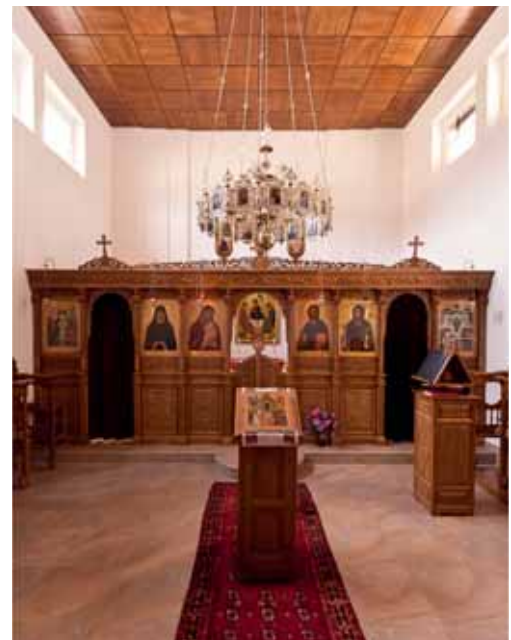
Die orthodoxe Kapelle in Freiburg.

Einige Gruppierungen konnten das Gebäude kaufen, in denen ihr Gebets- und Versammlungsraum untergebracht ist. Dies gilt für die Bruderschaft St. Pius X. in Granges-Paccot (sie hat eine Industrieliegenschaft so gekonnt umgebaut, dass man den Eindruck hat, es sei immer schon eine Kapelle gewesen). Bei den protestantischen Gemeinschaften sind es die Freie Evangelische Gemeinde Düdingen, die Alliance Pierres Vivantes in Siviriez, die Église réformée baptiste in Bulle, die Kirche der Siebenten-Tags-Adventisten in Freiburg und die Église La Perrausa in Saint-Martin, bei den Muslimen die türkische Gemeinschaft an der Route du Jura in Freiburg.