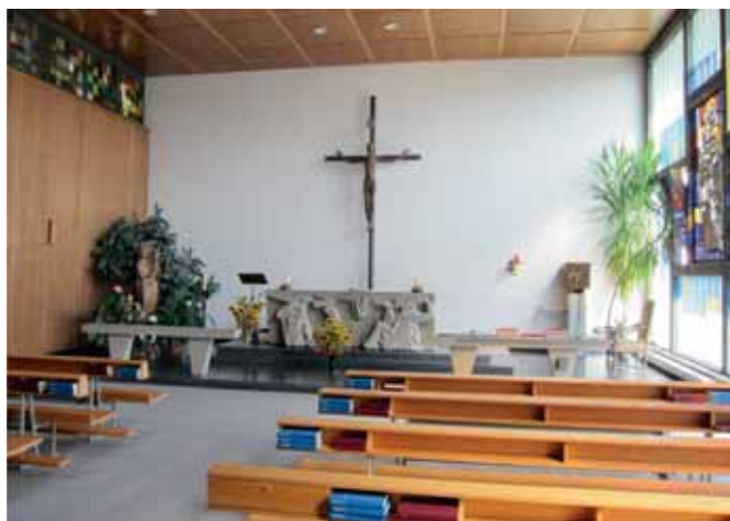
Die Kapelle des Spitals Tafers wird nicht nur von Patientinnen und Patienten besucht, sondern auch von Gläubigen aus der Region.

Der Jahresbericht 2010 der evangelisch-reformierten Kirche unterstreicht die «enge Zusammenarbeit mit dem Pflegepersonal» in den Spitälern. Diese ermögliche «eine angemessene Begleitung der Patientinnen und Patienten, die sich in spiritueller Not befinden, unabhängig ihrer Überzeugungen und ihres Glaubens». Dem Bericht zufolge wird das Angebot zur Unterstützung der Pflegepersonen, die in der Palliativpflege tätig sind, immer reger beansprucht 99 . Die Zusammenarbeit zwischen der katholischen und reformierten Spitalseelsorge ist laut unseren Gesprächspartnern sehr gut.