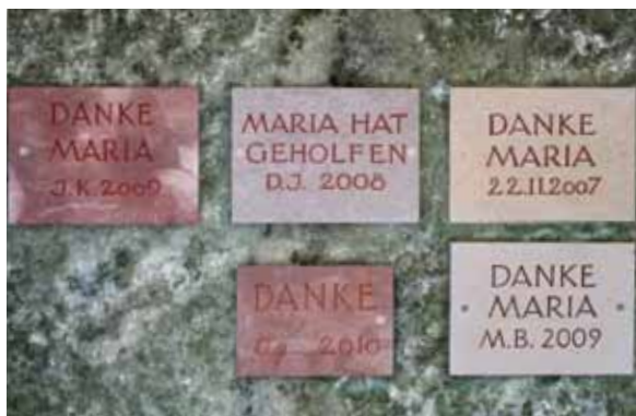
Votivtafeln in der Grotte der Kapelle von Tafers.

Was die internationale Rolle von Freiburg betrifft, so sei auch Missio ( www.missio.ch ) erwähnt, die Schweizer Zweigstelle des Internationalen Katholischen Missionswerks, die hier angesiedelt ist, wie auch weitere Institutionen mit Missionsauftrag.