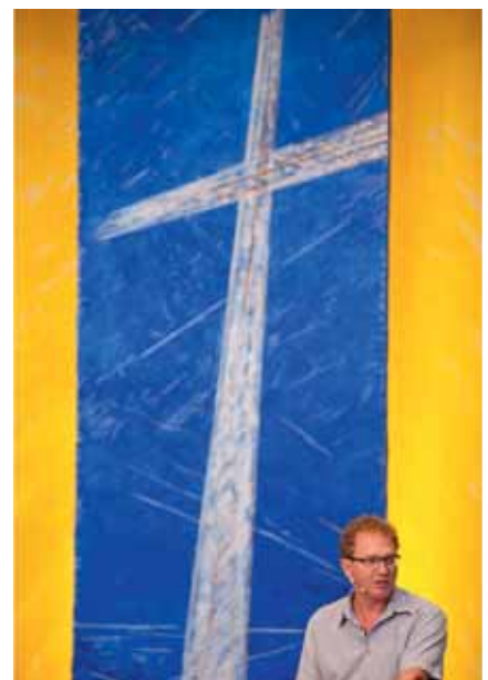
Predigt in der Freien Evangelischen Gemeinde Murten.

In einer Gesellschaft, in der die Menschen stark beansprucht werden, ist es nicht einfach, ihr Interesse für etwas Neues zu wecken. Ein Mitglied einer christlichen Gemeinschaft erinnert sich an die Enttäuschung eines in Freiburg lebenden Pfarrers, der einen öffentlichen Vortrag zu einem Thema organisiert hatte, in welchem er Experte war: Niemand kam, um den Vortrag zu hören ... Ein Verantwortlicher einer evangelischen Freikirche zieht daraus folgenden Schluss: «Die klassischen Formen der Evangelisation funktionieren nicht wirklich. Ich meine damit die Organisation von Treffen oder Anlässen wie beispielsweise Konzerte, das von-Tür-zu-Tür-Gehen usw. Diese Methoden funktionieren nicht. Die meisten dieser Anlässe ziehen ein Publikum an, das ausschliesslich aus Christen besteht.»