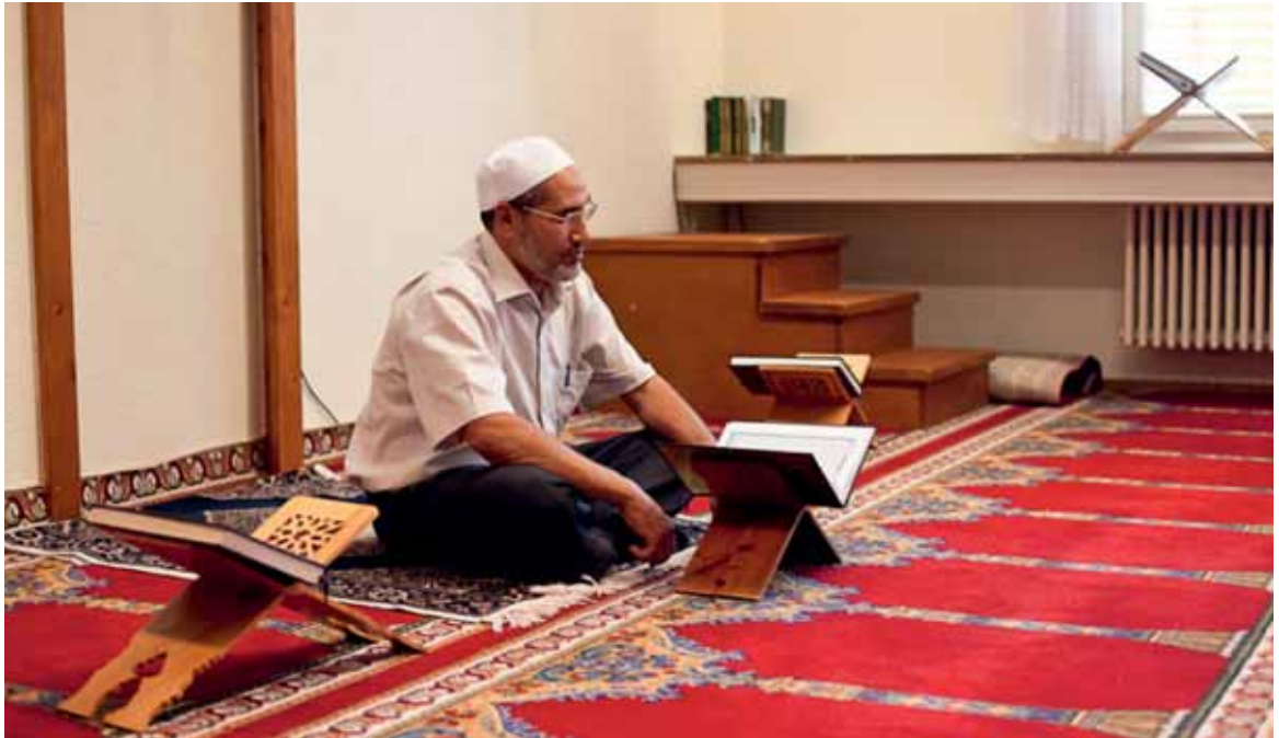
In der Moschee der Association des musulmans de Fribourg.

sich sicher nur um einen kleinen Prozentsatz handelt, denn es ist anzunehmen, dass sich die Kinder, die keine Angaben zu ihrer Religionszugehörigkeit machen, ungefähr gleich auf die verschiedenen Religionsgemeinschaften verteilen. Die Zahl 2190 ist eine realistische Grössenordnung, die wahrscheinlich um einige hundert Personen erhöht werden müsste.