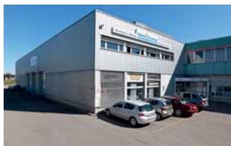
In diesem Gebäude in der Industriezone Moncor versammelten sich bis 2011 die Gläubigen der Kirche «L'Éternel est bon» und auch diejenigen von Espace Rencontre.