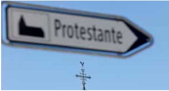
Châtel-Saint-Denis: Ein Schild weist den Weg zur reformierten Kirche, nicht weit von der katholischen Kapelle entfernt.

Andererseits erwähnen mehrere Personen ein Abflauen oder eine Abkühlung, was die Begeisterung für die Ökumene angeht. Die meisten Menschen interessierten sich nicht wirklich dafür, meinen sie.