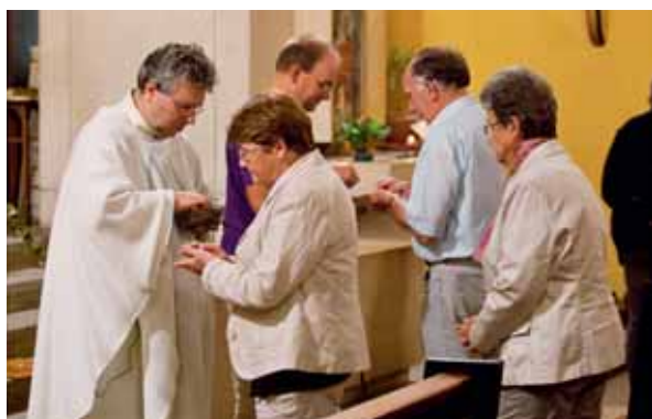
Kommunion in der Kirche Murist, während der Feier zu Mariä Himmelfahrt.

Die römisch-katholische Kirche ist die grösste religiöse Gruppe in der Schweiz (41,82% der Bevölkerung bei der Volkszählung 2000) und natürlich auch im Kanton Freiburg. Auf der Grundlage der Kirchenstatistiken gibt das Personalverzeichnis der Diözese für 2008 die Zahl von 184 243 römisch-katholischen im Kanton an 7 . Dies entspricht etwas mehr als einem Viertel der gesamten katholischen Bevölkerung der Diözese von Lausanne, Genf und Freiburg ( www.diocese-ldf.ch ), die vier Kantone umfasst.