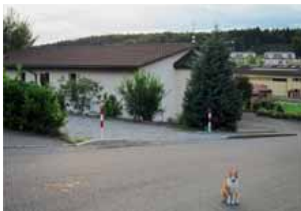
Die Kapelle Unsere Liebe Frau, Hüterin des Glaubens, in Granges-Paccot.

Der Fall der Priesterbruderschaft St. Pius X. sollte separat behandelt werden. Diese Gruppierung (deren Errichtungsdekret 1970 von Bischof François Charrière in Freiburg unterzeichnet worden ist) betrachtet sich als Bestandteil der römisch-katholischen Kirche, trotz ihrer speziellen Situation. Die Priester und die meisten Gläubigen im Kanton bezahlen ausserdem weiterhin die Kirchensteuer, obwohl sie die Kirchen der Pfarreien nicht besuchen, um «ihrer Liebe zur Kirche, dem Heiligen Vater, dem Bistum und den Bischöfen Ausdruck zu verleihen», wie uns mitgeteilt wurde. Die Priesterbruderschaft St. Pius X. verfügt über drei Gebetsorte im Kanton: die Kapelle Unsere Liebe Frau, Hüterin des Glaubens, die in einem ehemaligen Industriegebäude in der nähen Umgebung von Freiburg eingerichtet und 2001 eingeweiht worden ist (nach verschiedenen provisorischen Gottesdiensträumen), und für 140 Personen Platz bietet; das Maison Domus Dei, in Enney, wo Exerzitien organisiert werden, und eine Kapelle in Im Fang.