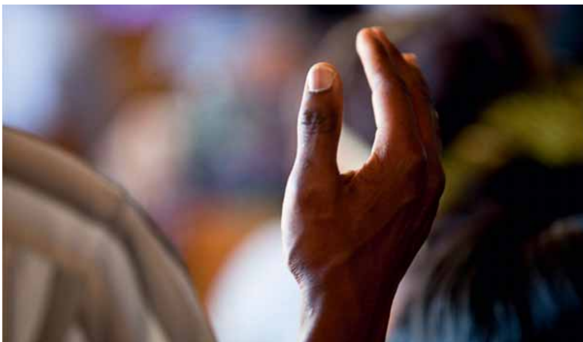
Gebet in der Kirche «L'Éternel est bon», Villars-sur-Glâne.

Zunahme ohne diese von aussen dazukommenden Mitglieder weniger gross. Bei den deutschsprachigen evangelischen Freikirchen ist der Anteil der internationalen Migration meist vernachlässigbar.