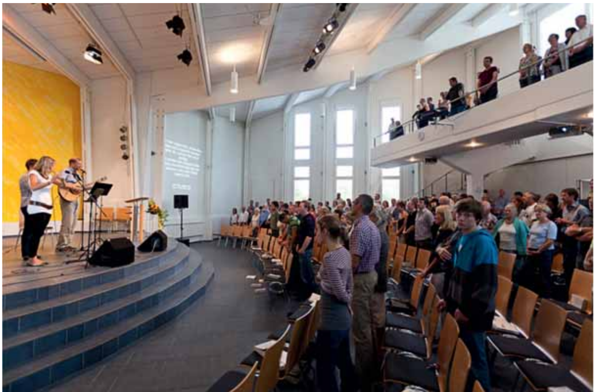
Freie Evangelische Gemeinde, Murten (© 2011 Nicolas Brodard – www.nicolasbrodard.com ).

Die Église réformée baptiste de Bulle ( www.erb-bulle.ch ) ist 1984 unter dem Namen Église évangélique missionnaire entstanden, unterstützt von der Vereinigung Freier Missionsgemeinden (VFMG), der sie seit 2000 nicht mehr angehört. Mit der aktuellen Bezeichnung der Kirche Bulle soll ihre Verbindung zur Reformation zum Ausdruck gebracht werden; sie steht in Verbindung mit anderen Gemeinschaften in der Westschweiz, die dieselbe Bezeichnung benutzen. Ihr Standort befindet sich seit 1997 in Räumlichkeiten, die sie am Chemin de Bouleyres kaufen konnte. Die Gemeinschaft fasst um die hundert Personen unter sich zusammen (einschl. der Kinder).