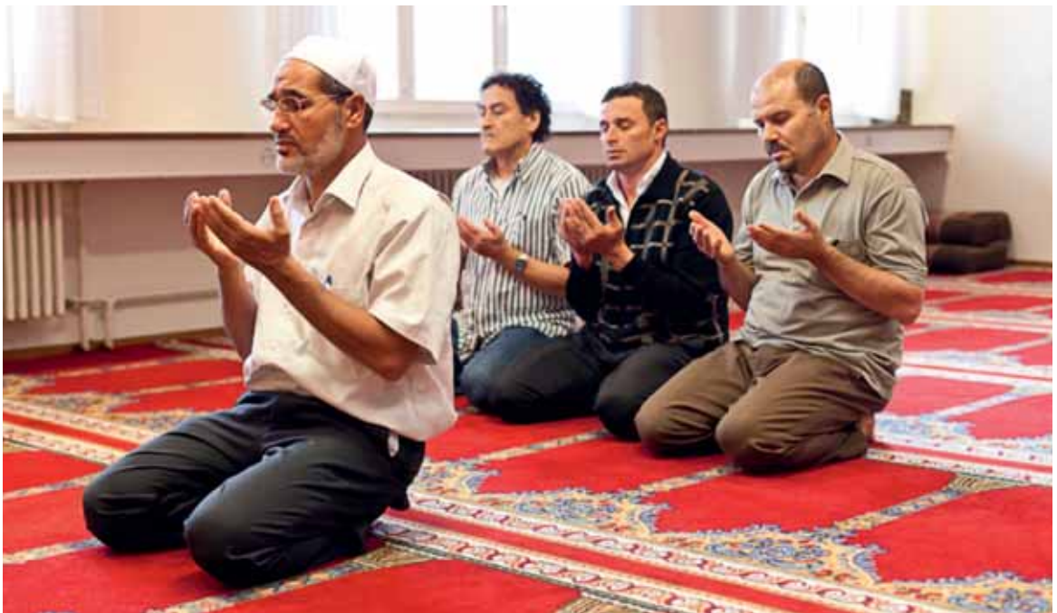
Moschee der Association des musulmans de Fribourg im Beaumont-Quartier in Freiburg.

Die Association des musulmans de Fribourg (AMF, www.amfr.ch ) wurde 1995 von arabischsprachigen Muslimen gegründet. Im Komitee sind mehrere Personen tunesischer Herkunft vertreten. Der Gebetsraum in Beaumont wird nicht nur von Tunesiern und Menschen aus anderen arabischen Ländern besucht, sondern auch von Somaliern, Eritreern und Konvertiten. Da in diesem Gebetsraum sowohl Arabisch als auch Französisch gesprochen wird, ist er für verschiedene Gruppen von Muslimen im Kanton attraktiv. Das