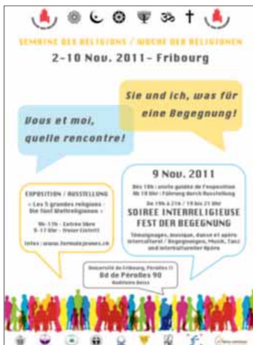
Ankündigung der Woche der Religionen im November 2011.

In Freiburg treffen sich im Rahmen von kleinen Gruppen Menschen zum interreligiösen Dialog, und insbesondere im Rahmen der Universität mit ihrem Institut für das Studium der Religionen und den interreligiösen Dialog (IRD, www.unifr.ch/ird ) finden solche Aktivitäten statt. Das Institut organisiert seit 2005 alljährlich ein (akademisches) Religionsforum. Die Seelsorgedienste der Universität bieten im Rahmen der Treffen «Maison de la Sagesse» interreligiöse Aktivitäten an.