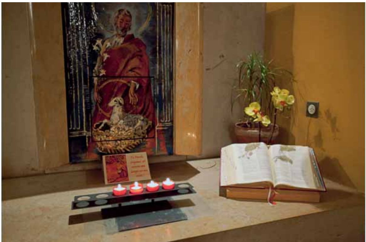
In der Kirche von Murist (© 2011 Nicolas Brodard – www.nicolasbrodard.com ).

Die freiburgische Gesellschaft (und allgemein die Schweizer Gesellschaft) wird Kontroversen um den Islam erleben, die aber vermutlich nicht durch endogene Faktoren ausgelöst werden, sondern eher Reaktionen auf breitere Diskussionen auf schweizerischer oder europäischer Ebene sind (vorbehaltlich unvorhersehbarer lokaler Ereignisse). Auf lokaler Ebene wird die Forderung nach einem muslimischen Grabfeld auf einem oder mehreren Friedhöfen des Kantons gestellt werden, obwohl die Mehrheit der muslimischen Vereinigungen eine weitere Debatte über den Islam derzeit sicher vermeiden möchte.