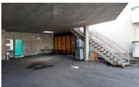
Eingang zum Albanisch-Islamischen Kulturverein Freiburgs.

Dass im Kanton Freiburg neue Kirchen gebaut werden, ist selten. Das jüngste Beispiel ist sicher die reformierte Kirche im Dorfzentrum von Bösing (eingeweiht 2008), die eine sehr moderne Architektur aufweist. Auf ihrer Fassade steht nicht Kirche, sondern «Arche». Anstelle von Neubauten sind die Anstrengungen zur Erhaltung der bestehenden Gebetsräume und die zahlreichen Renovationen zu vermerken, von denen der gute Zustand der meisten Gotteshäuser zeugt, die man besuchen kann.