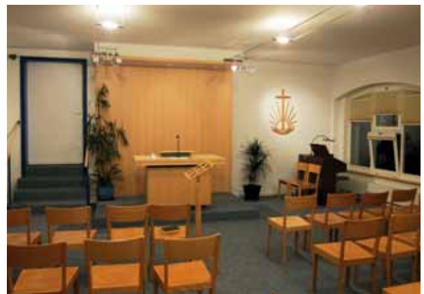
Im Gottesdienstraum der Neuapostolischen Kirche in Bulle, nach einem Abendgottesdienst (© 2011 J.-F. Mayer).

Die Gemeinschaft in Freiburg besteht ohne Unterbruch seit 1934. Sie zählt ungefähr 120 Mitglieder. Auch hier kann die Hälfte davon als aktiv bezeichnet werden. Der Gottesdienst wird auf Französisch gefeiert, beinhaltet aber oft einen Kurzbeitrag von einigen Minuten auf Deutsch.