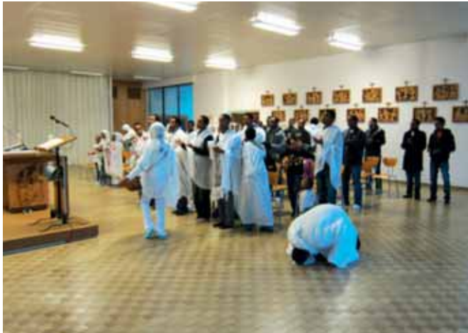
Ein Sonntagsgottesdienst der eritreisch-orthodoxen Gemeinde Freiburg in Abwesenheit eines Priesters, in der katholischen Kapelle Villars-Vert, in Villars-sur-Glâne.