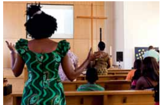
Gottesdienst der Église du Christ in der reformierten Kirche Freiburgs, 28. August 2011. (© 2011 Nicolas Brodard – www.nicolasbrodard.com ).

Ein anderer evangelikaler Pfarrer sagte, seine Gemeinde sei für Gläubige afrikanischer Herkunft eine Brücke zwischen ihrer eigenen Kultur und der Schweizer Kultur. Sie akzeptieren, dass sie ihren Glauben hier anders leben, und entdecken auch die demokratischen Funktionsregeln in der Kirche.