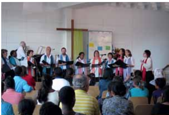
Im Rahmen der Aktivitäten von CABES empfangen evangelikale Christen Asylbewerberinnen und Asylbewerber zu einer Versammlung, nach der es ein Essen und eine Kleiderverteilung gibt.

Es gibt auch Initiativen von Religionsgruppen zur Unterstützung der am meisten benachteiligten Migrantinnen und Migranten. Einige Beispiele zeigen die Vielfalt der Projekte, aber auch die unterschiedlichen Ansätze.