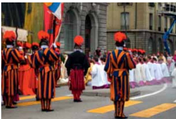
Vor einem Stationsaltar, Fronleichnamprozession 2010.

Gemäss den Bevölkerungsszenarien wird der Anteil der römisch-katholischen Einwohnerinnen und Einwohner der Schweiz 2050 bei 26 bis 38% (2000: 42%) und derjenige der Protestantinnen und Protestanten bei 16 bis 25% (2000: 33%) liegen. Laut dem Szenario mit dem stärksten Mitgliederrückgang könnte der Anteil der Konfessionslosen auf bis zu ein Drittel der Bevölkerung ansteigen, falls die Säkularisierung weiter fortschreitet 121 .