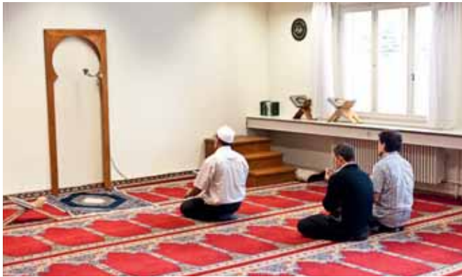
Gläubige beim Gebet in der Moschee der Association des musulmans de Fribourg.

Die Wahrnehmung der Musliminnen und Muslime durch die nichtmuslimische Bevölkerung Freiburgs hängt nicht nur von der lokalen Entwicklung ab: Wir werden beeinflusst von den Ereignissen anderswo in der Welt, von der Islamdebatte in anderen Kantonen oder in anderen Ländern. In den Medien ist der Islam seit zehn Jahren ein häufiges Thema. Auch wenn dies oft mit Spannungen zusammenhängt, bemüht sich die Presse, auch bei anderen Gelegenheiten über die Muslime zu berichten: Heute gibt es beispielsweise zum Ramadan oft einen Artikel mit Porträts oder einem speziellen Fokus zu diesem Brauch. Manchmal geht es dabei darum, der Leserschaft die hiesigen Muslime und ihre Praktiken näher zu bringen.