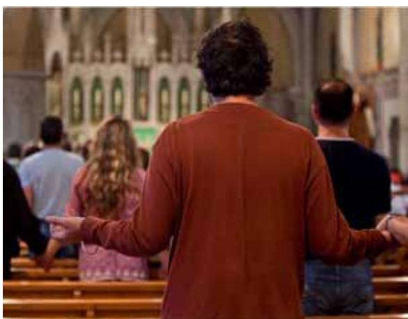
Während einer liturgischen Feier.

Ein reformierter Pfarrer hat festgestellt, dass «die Konfirmation immer noch ein sehr soziales und konventionelles Ereignis ist. Man spürt aber, dass es für die Jugendlichen eher eine Pflicht ist. Anschliessend entsteht eine Lücke zwischen 16 und 30 Jahren.» Hier stellt sich die Frage, wie viele Gläubige wieder aus diesem «Loch» auftauchen werden.