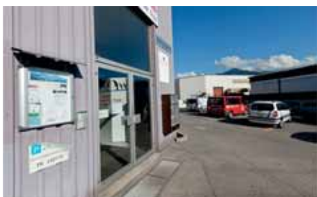
Eingang zu den Räumlichkeiten der Église évangélique apostolique in Bulle.