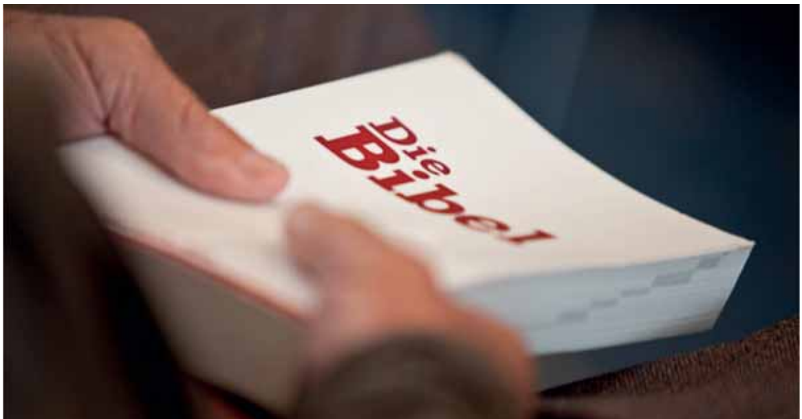
Die Bibel als gemeinsame Grundlage für alle Christen (© 2011 Nicolas Brodard – www.nicolasbrodard.com ).

Hier soll auch noch angemerkt werden, dass sich an verschiedenen Orten Beziehungen zwischen der reformierten Kirche und den evangelischen Freikirchen entwickelt haben. «Ich bin der Meinung, dass die Protestanten zusammenfinden sollten», so ein Pfarrer, der Beziehungen zu den freikirchlichen Gemeinschaften aufbauen möchte. Eine solche Annäherung sei in einem katholischen Gebiet besonders wichtig. Einige Pastoren aus evangelischen Freikirchen sprechen ihrerseits von einer klaren Verbesserung der Beziehungen, währenddem andere keine grosse Veränderung bemerken. Es scheint, dass dies alles von den Orten und den Pastoren abhängt 63 . In einigen Ortschaften werden die Beziehungen als «brüderlich» bezeichnet. In Estavayer-le-Lac finden mehrmals jährlich an einem Sonntagabend gemeinsame Lobpreiszeiten für Gläubige aus den reformierten und den freikirchlichen Gemeinschaften statt.