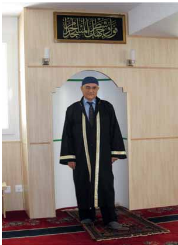
Der Imam der Moschee an der Route du Jura in Freiburg.

spontan, man dürfe nicht alle Muslime mit den Taliban gleichsetzen; diese Minderheitsgruppierungen seien nicht repräsentativ. Als wir ihn darauf hinwiesen, dass wir dies nicht bezweifeln und das Thema auch gar nicht angesprochen hätten, antwortete er, seine Reaktion sei typisch für das ständige Gefühl, sich rechtfertigen zu müssen. Dies gilt natürlich nicht nur für den Kanton Freiburg, wo übrigens keine besonderen Spannungen mit der Gesellschaft erwähnt werden.