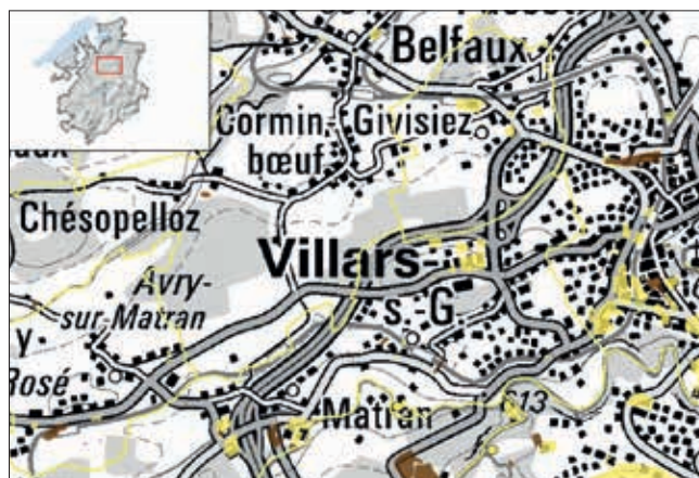
Auszug aus dem Kataster des Kantons Freiburg ( www.geo.fr.ch , Thema Umwelt). Die Deponien sind in Braun und die Betriebsstandorte in Gelb eingezeichnet.

Am 15. Oktober 2008 wurde der Freiburger Kataster der belasteten Standorte veröffentlicht.