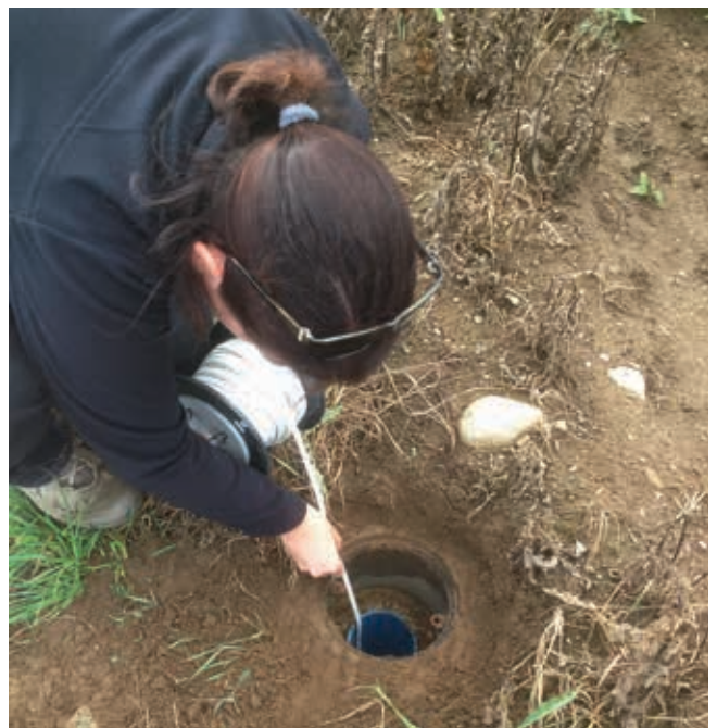
Untersuchungen auf einer ehemaligen Deponie (Grundwasserentnahme)