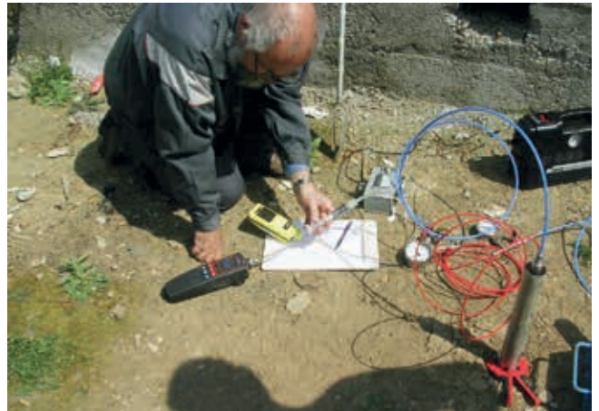
Untersuchungen auf einem ehemaligen Betriebsstandort (Bodenprobenahme und Kontrolle der Porenluft)