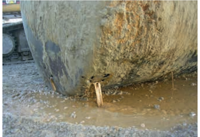
Kohlenwasserstoffbelasteter Standort in der Stadt Freiburg, der anlässlich des Baus eines neuen Gebäudes saniert wurde (der undichte Tank war im Boden versenkt).

Über die Webanwendung www.sit.fr.ch/certifsipo kann für Parzellen, die nicht im Kataster der belasteten Standorte eingetragen sind, eine entsprechende Bescheinigung generiert werden. Dieses Dokument muss für jede Transaktion dem Grundbuchamt übermittelt werden. Ist das Grundstück hingegen von einem belasteten Standort betroffen, so muss beim AfU ein Gesuch für die Bewilligung der Veräusserung oder Teilung des Grundstücks eingereicht werden. Dieses Formular steht unter derselben Adresse zur Verfügung.