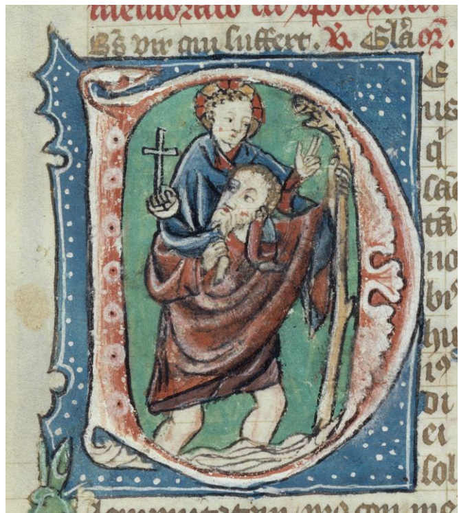
Brevier (um 1400), vom Silvesteraltar der Kirche St. Nikolaus, KUB Freiburg

➔Es erleichtert die Arbeit der Kunstvermittlerin, wenn die Vornamen der SuS auf einer Klebeetikette vorbereitet werden. Merci!