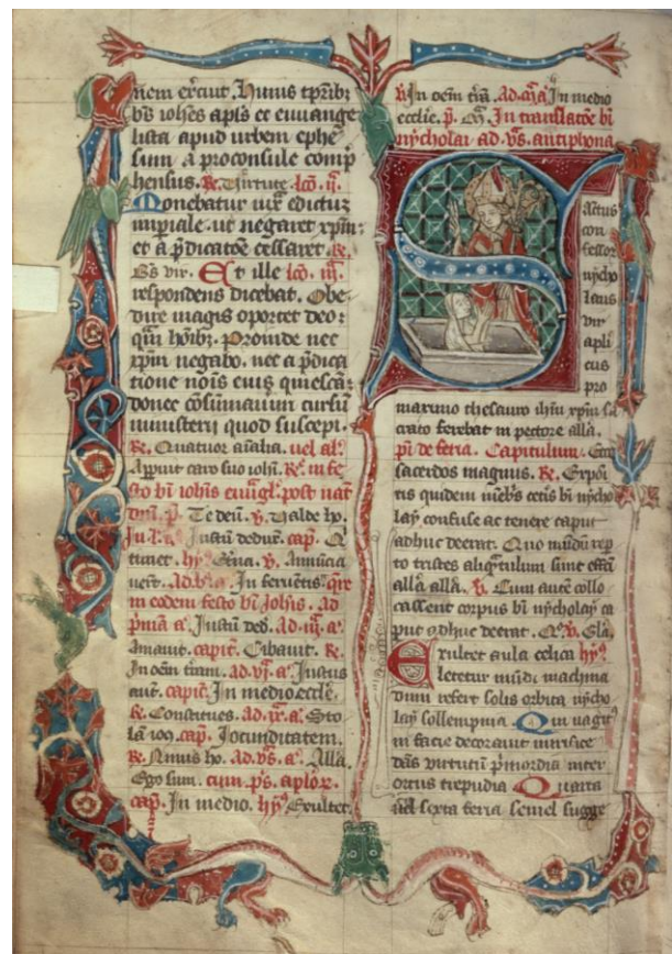
Brevier (um 1400), vom Silvesteraltar der Kirche St. Niklaus, KUB Freiburg