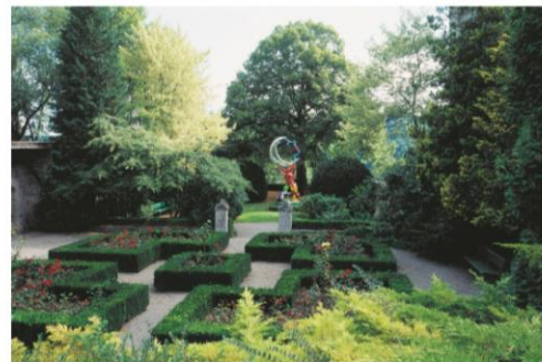
Blick aus dem Garten des Museums, Der Mond (1985/1992), Niki de Saint Phalle

Nur ein kleiner Teil der Gebäude, in denen sich das Museum für Kunst und Geschichte heute befindet, wurde für museale Zwecke gebaut: die beiden Säle für Sonderausstellungen (1964). Im Übrigen hat sich die Institution in drei Bauten eingerichtet, die ursprünglich ganz andere Funktionen hatten: in einem vornehmen Stadtpalais aus der Renaissance – Ratzehof – sowie in einem Schlacht- und einem Zeughaus des 19. Jahrhunderts. Der Garten des Museums ist Schauplatz für diverse Skulpturen und Plastiken.