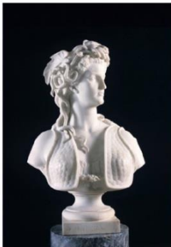
Die Gorgo Medusa (1865), Marcello