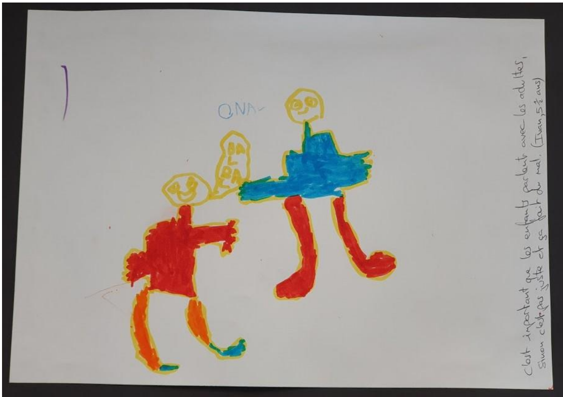
«Es ist wichtig, dass die Kinder mit den Erwachsenen sprechen, sonst ist es nicht richtig und tut weh.» (Ivan, 5,5 Jahre)