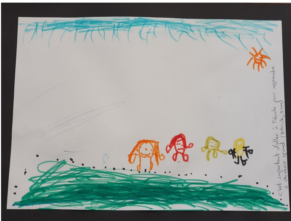
«In die Schule gehen ist wichtig, da lernt man, gross zu werden.» (Patrick, 5 Jahre)