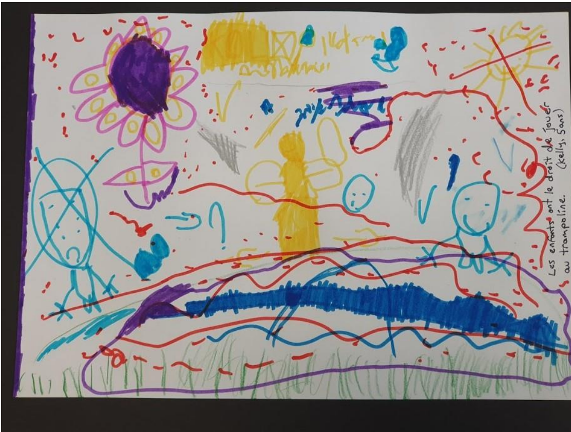
«Kinder haben das Recht, auf dem Trampolin zu spielen.» (Kelly, 5 Jahre)