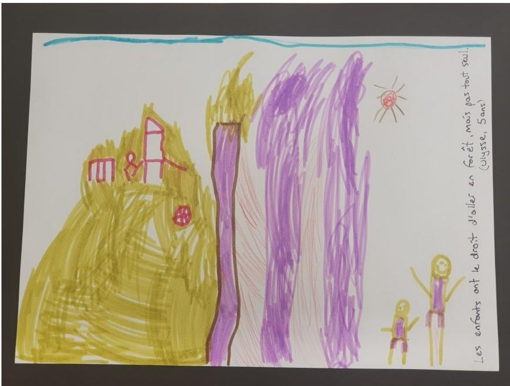
«Kinder haben das Recht, in den Wald zu gehen, aber nicht ganz alleine.» (Ulysse, 5 Jahre)