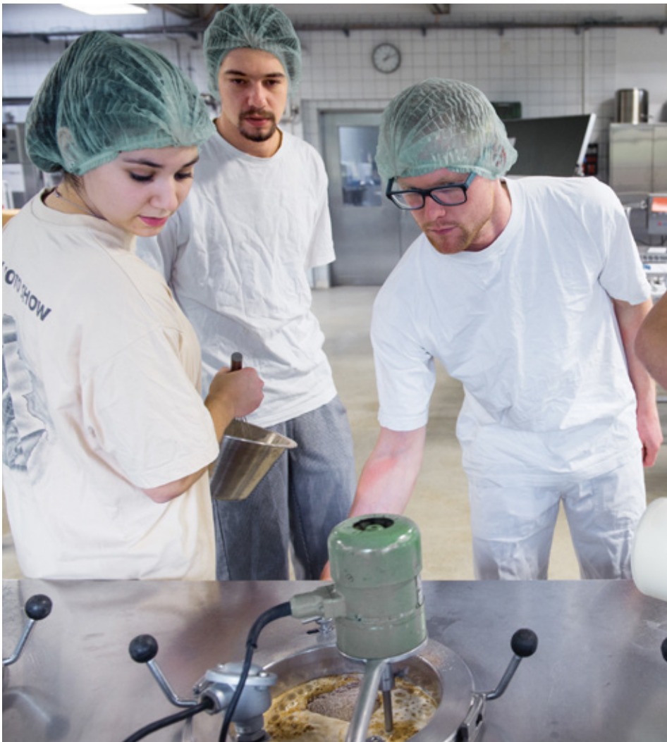
Des travaux pratiques dans la halle de technologie agroalimentaire.

Die Höhere Fachschule für Lebensmitteltechnologie erlebt eine neue Dynamik. Die Abklärungen über den Wechsel zur berufsbegleitenden Ausbildung sind abgeschlossen und 2019-2020 findet das Studienjahr zum letzten Mal in Vollzeit statt. Die Exzellenz und Aktualität der Ausbildung stehen stets im Zentrum unserer Bestrebungen genau wie die Beziehungen zu den Betrieben, die von grösster Wichtigkeit sind.