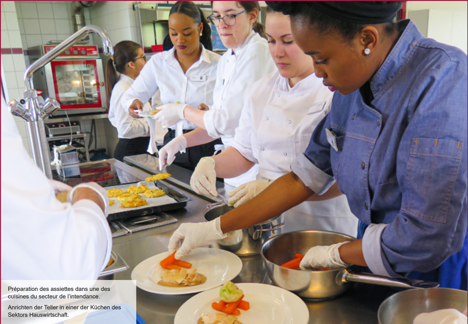
Préparation des assiettes dans une des cuisines du secteur de l'intendance. Anrichten der Teller in einer der Küchen des Sektors Hauswirtschaft.