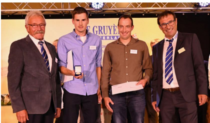
Une médaille d'or pour le Gruyère AOP produit par la fromagerie-école.

Die Schulkäserei von Grangeneuve erhielt 2019 eine Goldmedaille für die Qualität des Gruyère AOP der letzten fünf Jahre (60 Taxierungen), mit einer durchschnittlichen Taxierung von 19.42 von 20 Punkten. Der Vacherin Fribourgeois AOP liegt mit 19.1