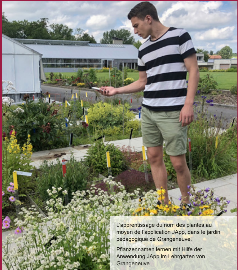
L'apprentissage du nom des plantes au moyen de l'application JApp, dans le jardin pédagogique de Grangeneuve. Pflanzennamen lernen mit Hilfe der Anwendung JApp im Lehrgarten von Grangeneuve.