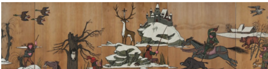
« Scène de chasse », gouache sur bois de Teddy Aeby.

Rund 800 Personen besuchten die Infrastrukturen von Grangeneuve. Die Hälfte davon waren Schulkinder.