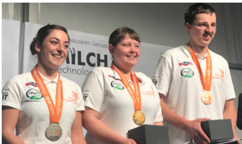
Lors des SwissSkills des métiers du lait, trois élèves de Grangeneuve ont décroché les premières places.

Die Schulkäserei erhielt ihrerseits eine Goldmedaille von der Sortenorganisation Gruyère für die Herstellung von Käsen mit höchster Taxierung während fünf Jahren.