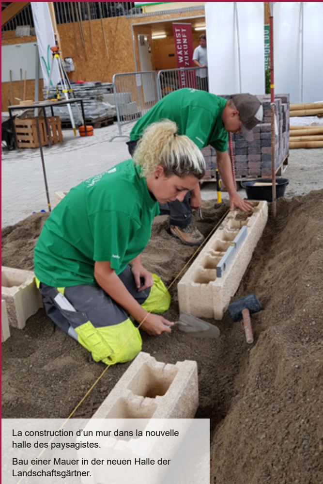
La construction d'un mur dans la nouvelle halle des paysagistes. Bau einer Mauer in der neuen Halle der Landschaftsgärtner.