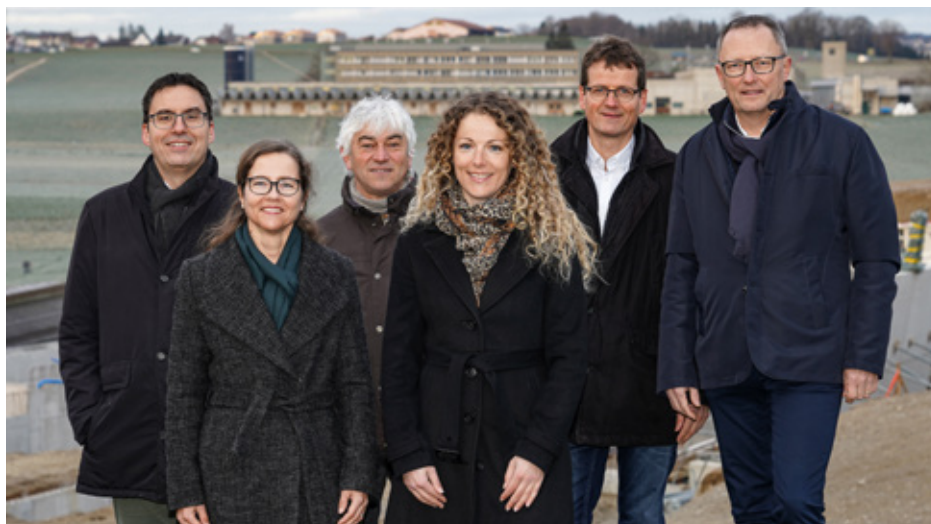
Membres du Conseil de direction Mitglieder des Direktionsrates