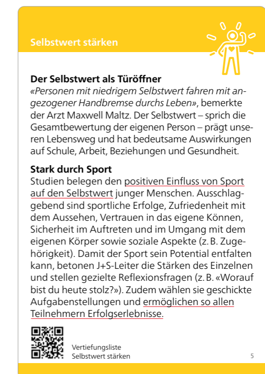
Abbildung 2: Handlungsempfehlung «Selbstwert stärken»

Ein neuer Sportförderansatz für die weniger leistungsstarken Schülerinnen und Schüler.