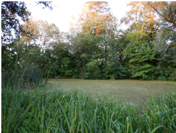
Partie ouest – septembre 2018