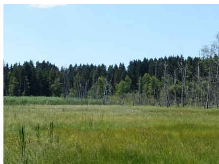
Mosses de la Rogivue: Naturschutzgebiet mit faszinierender Vielfalt (Punkt 6)