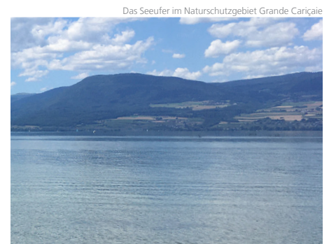
Das Seeufer im Naturschutzgebiet Grande Cariçaie