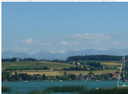
Panorama von Sugiez: Der Strand ist ideal zum Baden und Entspannen.