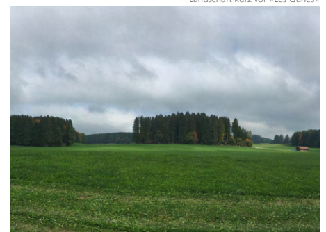
Landschaft kurz vor «Les Gurles»