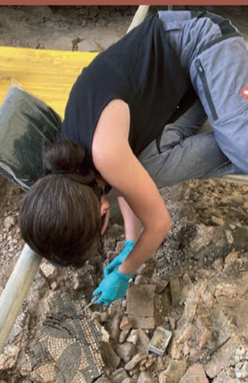
Les restauratrices au travail : stabilisation des tesselles par injection.

L'étude approfondie de tous les mobiliers aidera à mieux dater les différentes étapes de construction de la villa et, dans la mesure du possible, à identifier la fonction de certaines pièces qui la composent. Elle contribuera aussi à cerner plus précisément les habitants de ces lieux riches et luxueux.