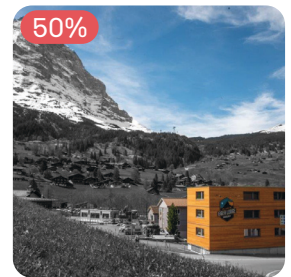
★★★★★ Eiger Lodge Grindelwald