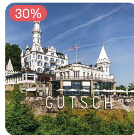
★★★★★ Château Gütsch Luzern