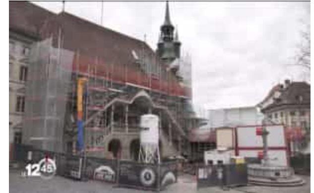
Une fresque inconnue du XV e siècle découverte à