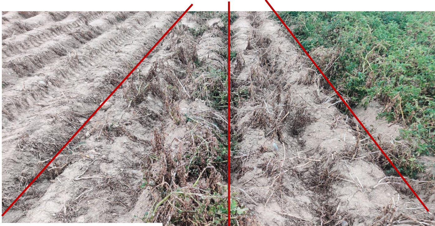
Markies 1x Spotlight Plus