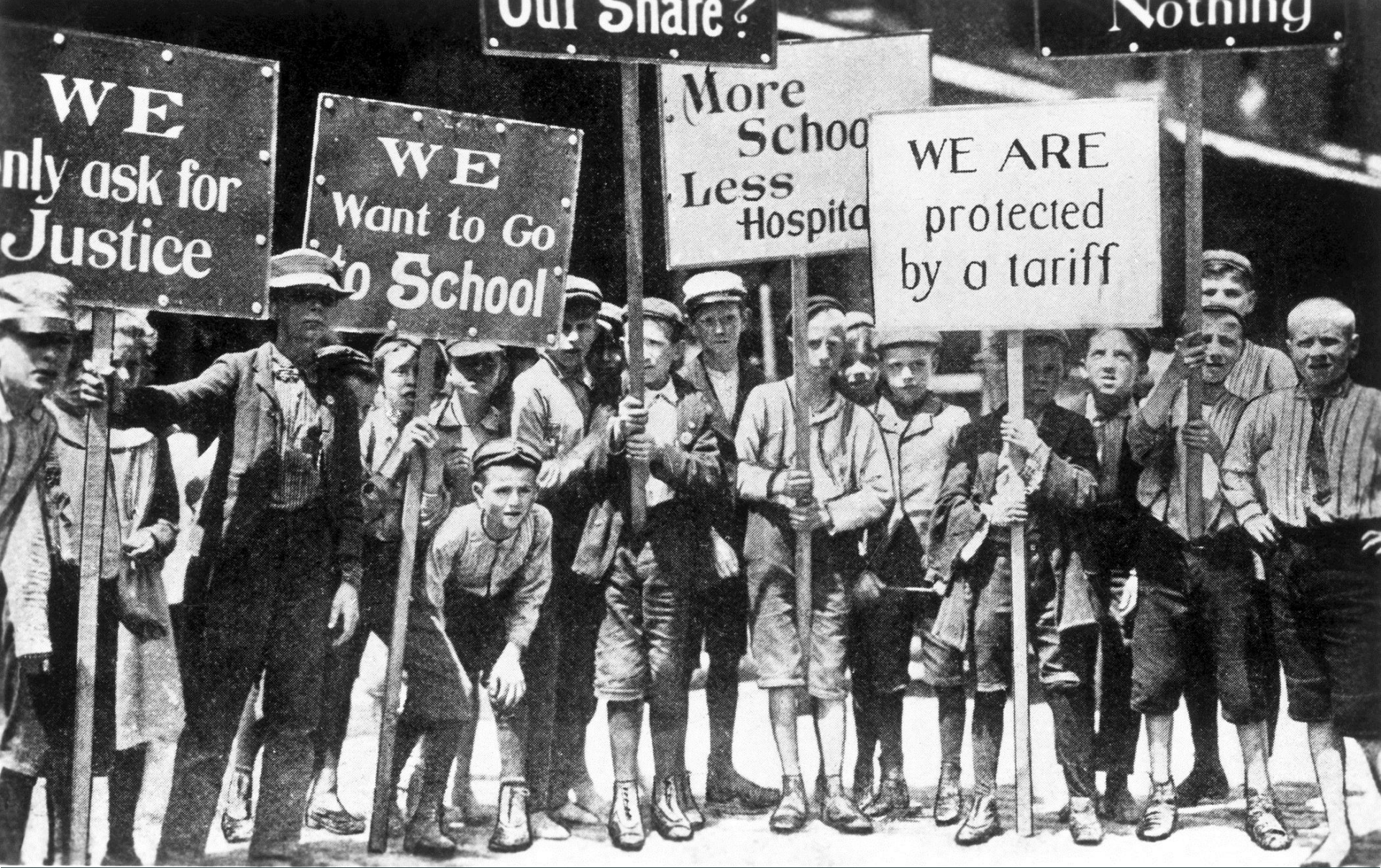
Philadelphia, 1903, « Children's Crusade »