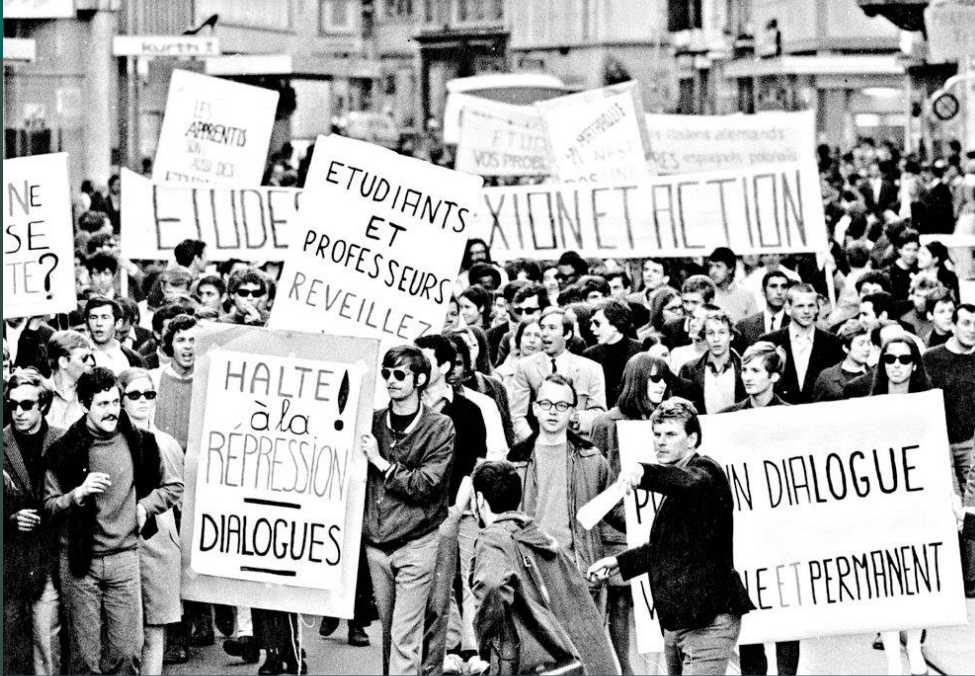
Mai 1968 in Neuchâtel