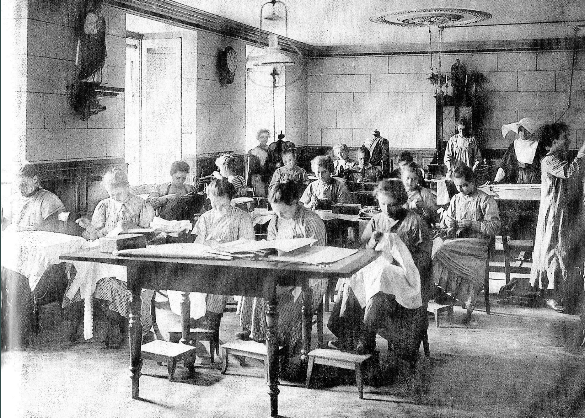
«Ouvroir des Enfants de Marie», La Providence, FR, Ende XIXe J.