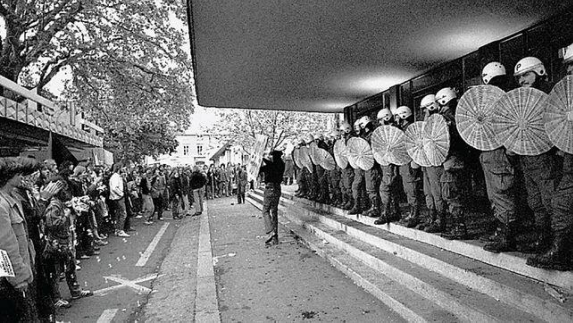
Zürich, 30. Mai 1980, die Jugendlichen verlangen ein autonomes Zentrum und demonstrieren vor der Oper, der soeben von der Gemeinde ein hohes Budget zugesprochen wurde