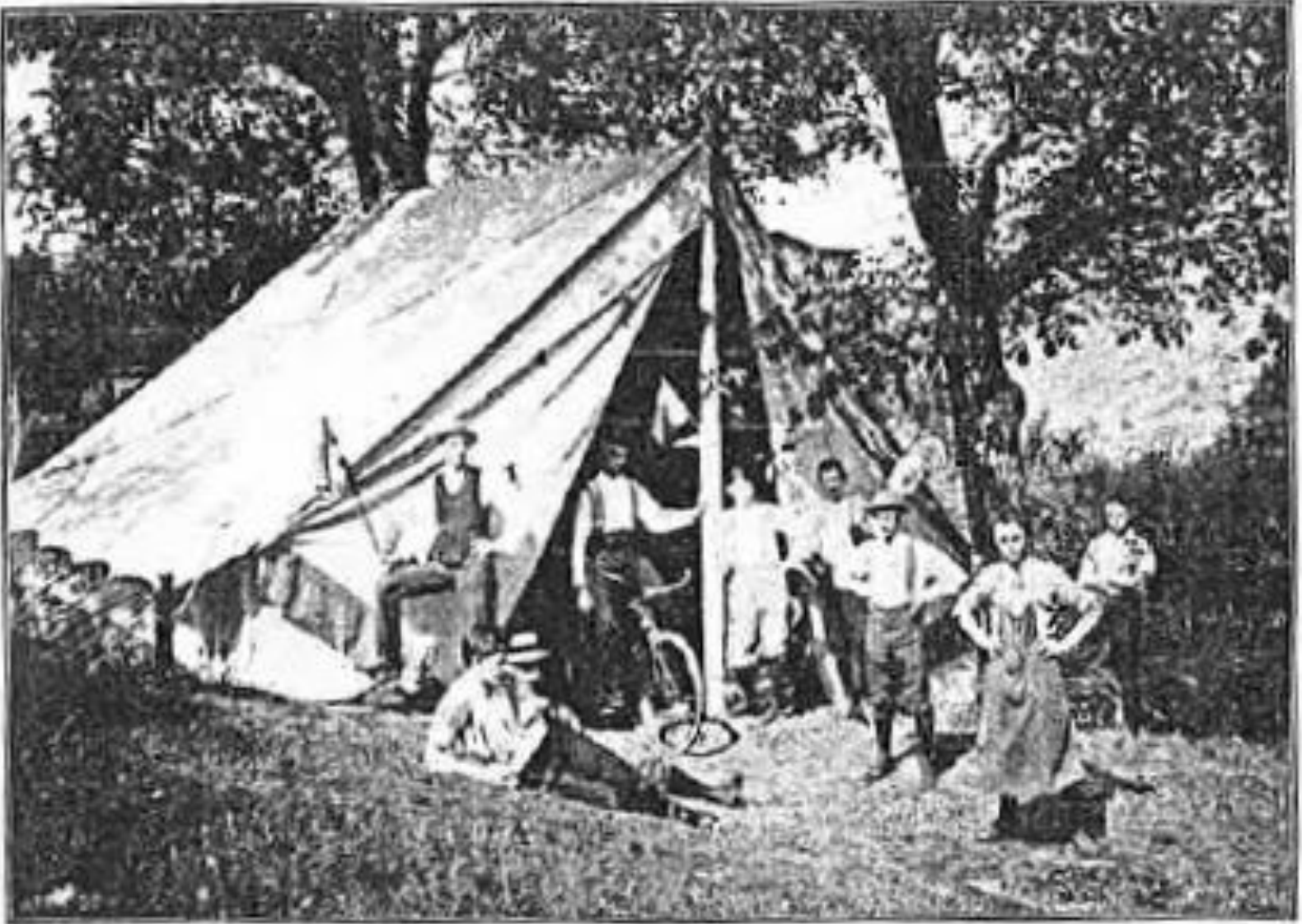
LE PREMIER CAMP D'ÉCLAIREURS SUISSES Lancy — août 1911.

Erschienen in: La Patrie Suisse , 10. April 1912, S. 90.