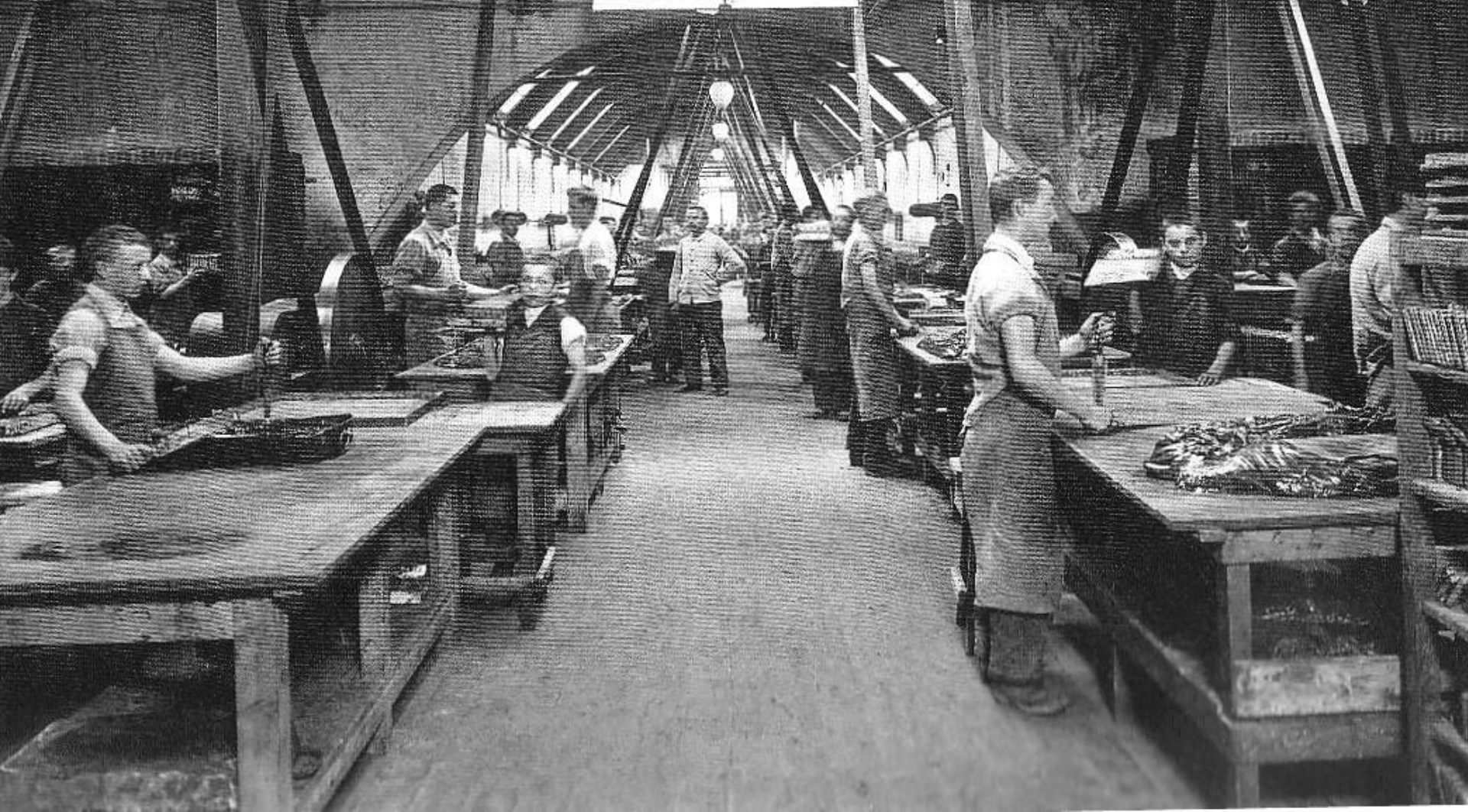
Schokoladenfabrik von Broc, 1902