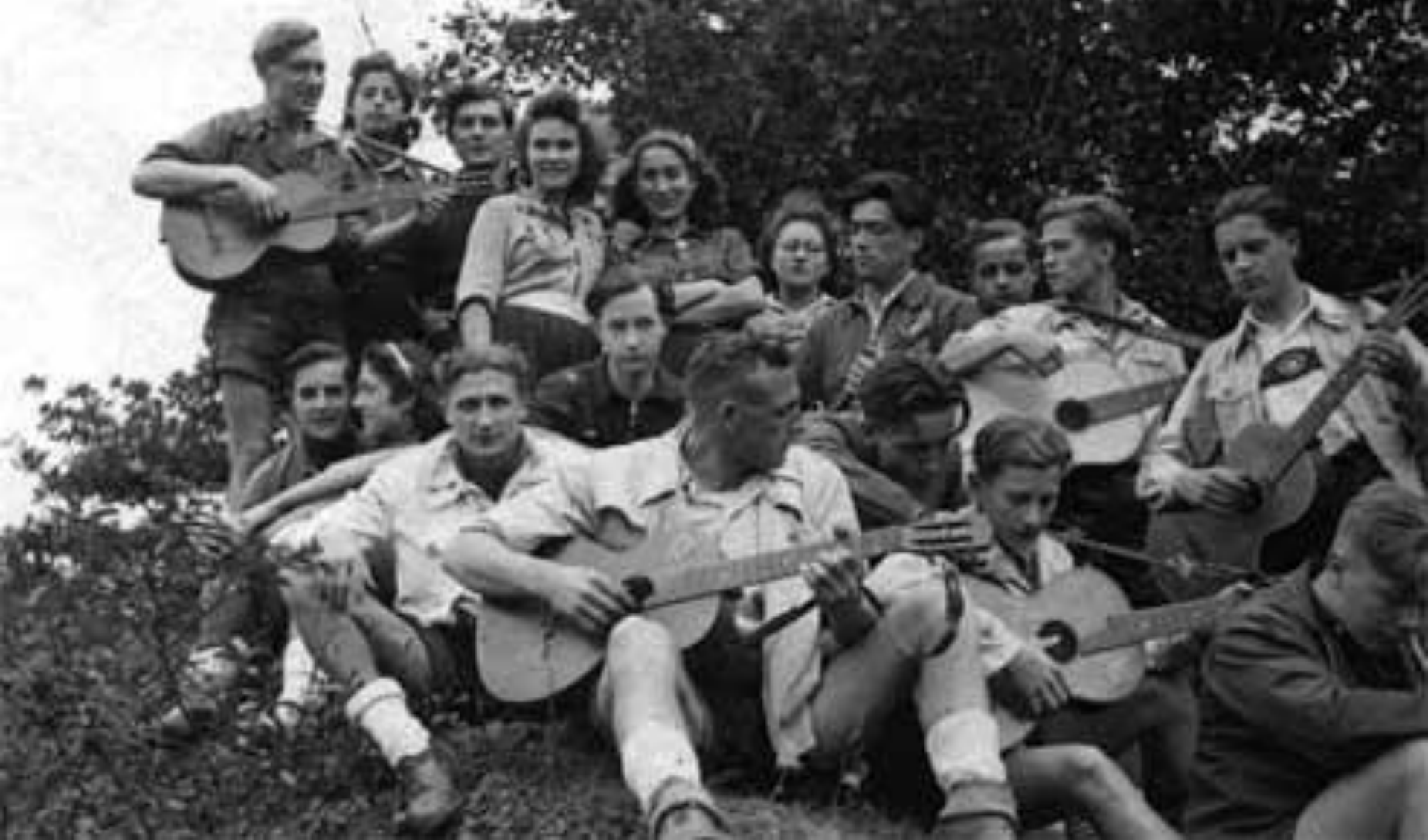
Edelweisspiraten, Köln, nicht datiert