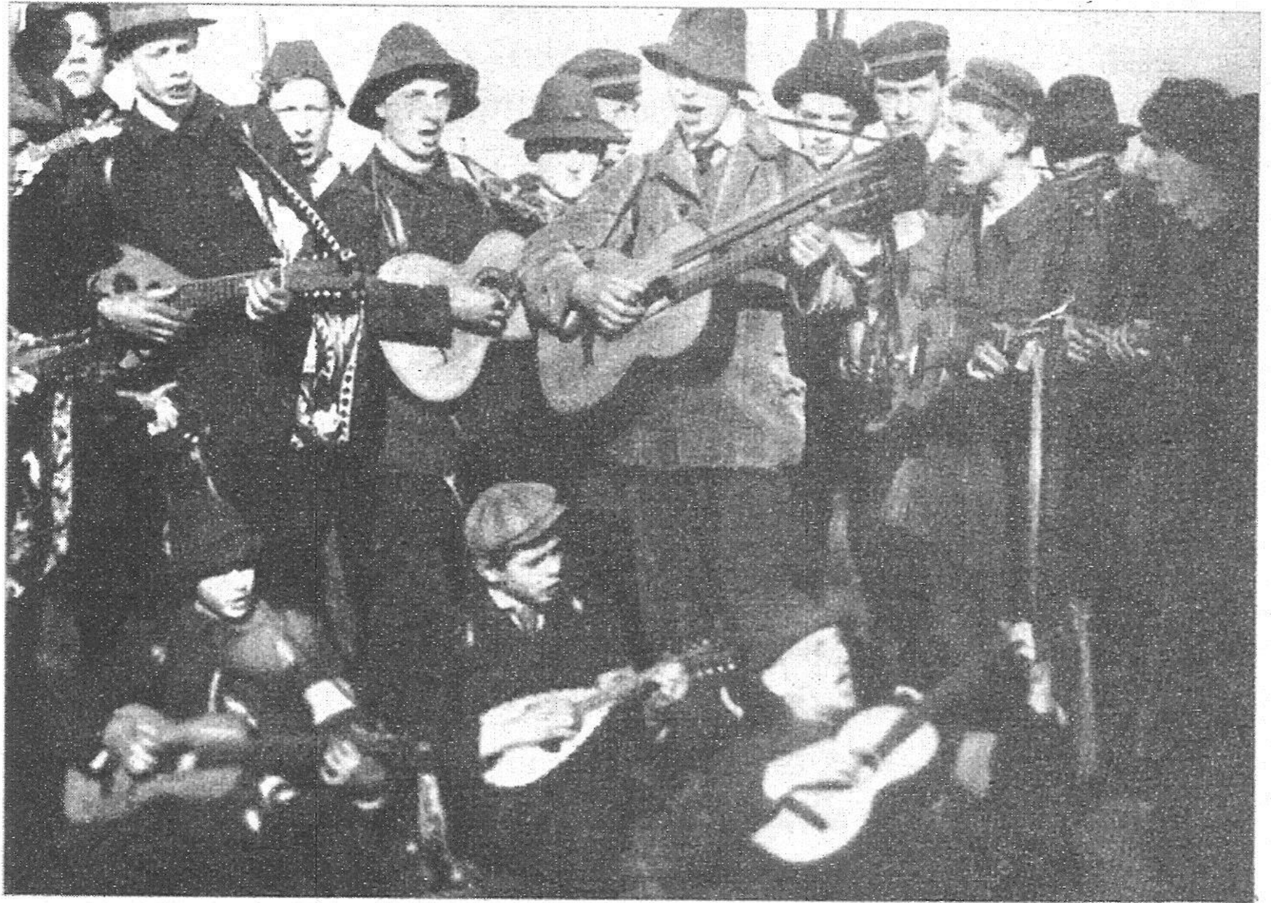
WANDERVOGEL ON LUNEBERG HEATH, 1909