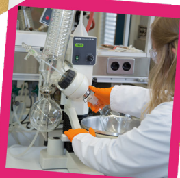
Santé et social

L'Etat de Fribourg vous permet de réaliser votre formation professionnelle initiale dans plus de 20 métiers différents repartis dans 5 domaines d'activités :