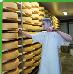
Terre et nature