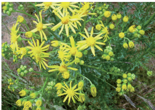
Flleurs de séneçon jacobée P. Aeby, IAG

Des moyens de lutte existent, mais il est essentiel d'y avoir recours dès l'apparition des premières plantes, avant qu'un stock grainier ne soit constitué.