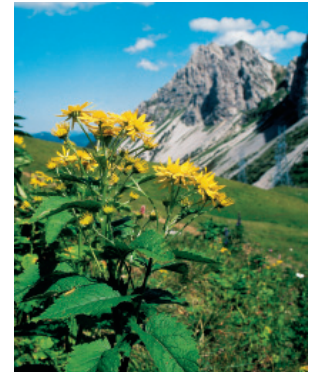
W. Dietl, ART