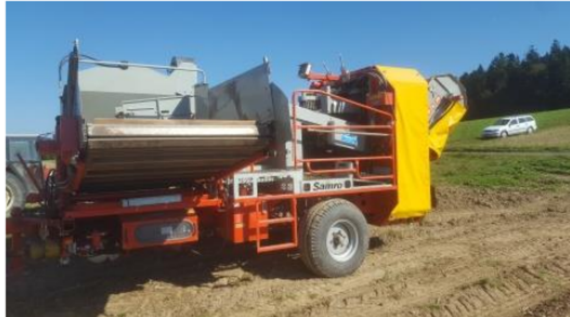
Illustration 1 : L'arracheuse-récolteuse

Pour l'arrachage nous avons loué une Samro. Il fallait cinq personnes sur la machine et un chauffeur. Nous avons encore préparé nos deux remorques, une pour les pommes de terre de consommation et une pour les déchets fourragers.