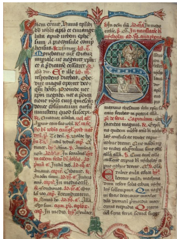
Bréviaire (vers 1400), de l'autel Saint-Silvestre de l'église Saint-Nicolas, BCU Fribourg