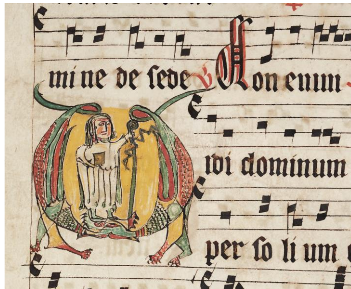
Antiphonaire (avant 1318), abbaye cistercienne de la Maigrauge

A partir de ces témoins enluminés contemporains et de leur mise en page, les élèves créent leurs propres initiales et élargissent ainsi la notion de leur propre écriture manuscrite. Les ornements, les bordures et les dessins marginaux leur servent de modèles créatifs. Pour la réalisation de leur travail personnel et artistique, ils utiliseront des encres et de la feuille d'or, matériaux auxquels ils sont peu habitués.