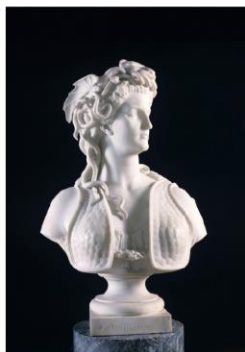
La Gorgone (1865), Marcello