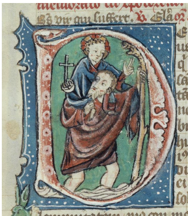
Bréviaire (vers 1400), de l'autel Saint-Silvestre de l'église Saint-Nicolas, BCU Fribourg

Le matériel est mis à disposition par le musée d'art et d'histoire. Les élèves repartent avec leur création enluminée.