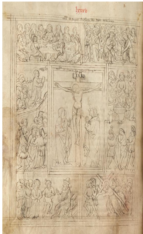
Missel (1410-1420), BCU Fribourg