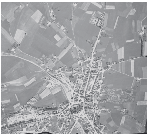
Vue aérienne de Bulle, 1943