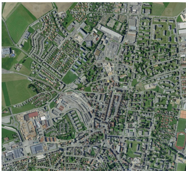
Vue aérienne de Bulle, 2015