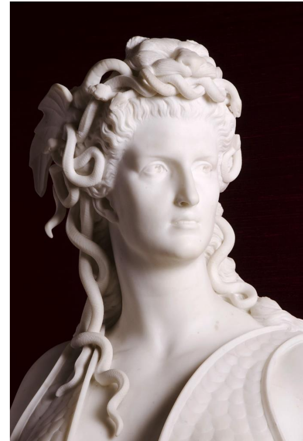
Marcello, La Gorgone (détail), 1865

Si tu veux, tu peux nous envoyer tes dessins ou une photo de ceux-ci !