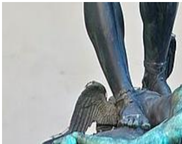
Persée de B. Cellini, Florence (détail)