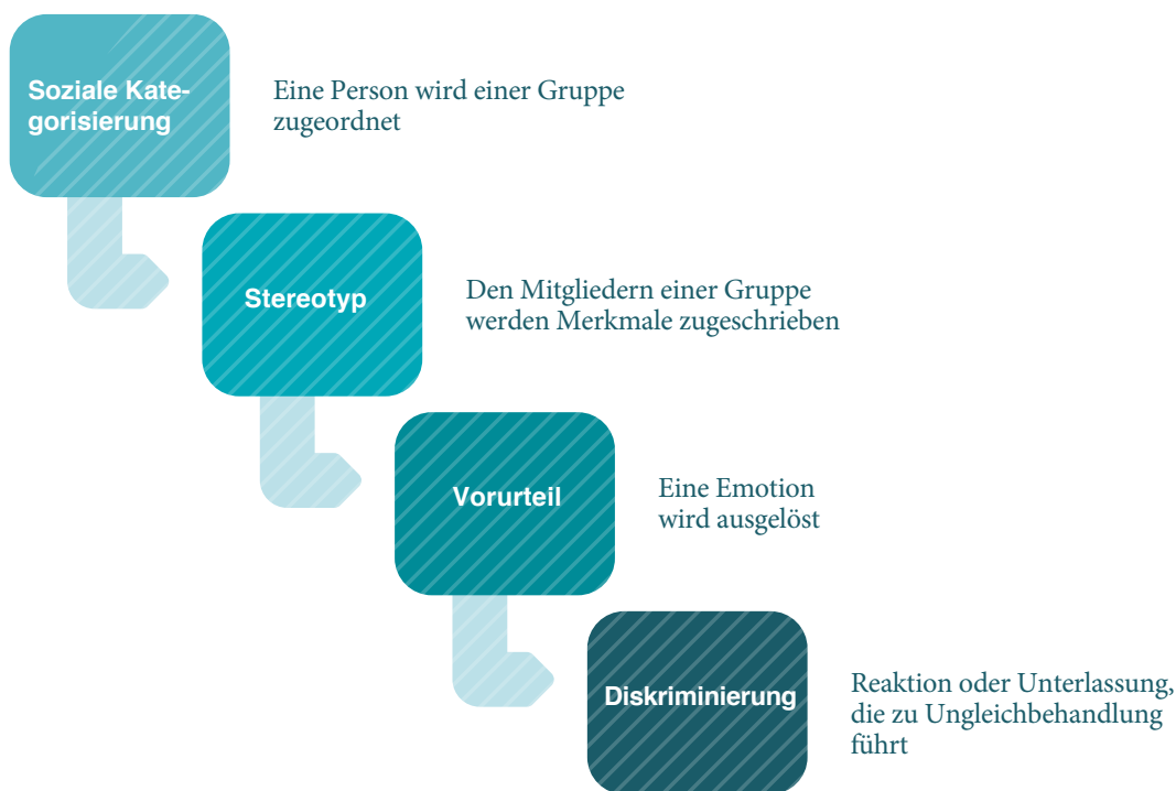
Abbildung 1: «Konstruktion» der Diskriminierung Darstellung des Prozesses, der zu einer diskriminierenden Handlung führt.