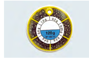
Grenaille de plomb