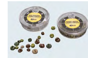
Lest-grenaille en étain