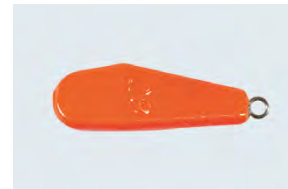
Plomb de traîne