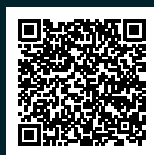
PDF du dépliant

Le plomb n'est pas le seul matériau problématique pour les organismes vivants dans les cours d'eau. Les plastiques, tels que le caoutchouc, les fils de pêches et d'autres matériaux synthétiques peuvent également être nuisibles pour les organismes aquatiques, que ce soit par l'émission de substances dangereuses ou par leur ingestion avec la nourriture. Il faut donc veiller à ce que ces matériaux ne soient pas rejetés dans l'environnement. La nature t'en sera reconnaissante !