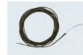
Pointes plongeantes à base de tungstène (pêche à la mouche)