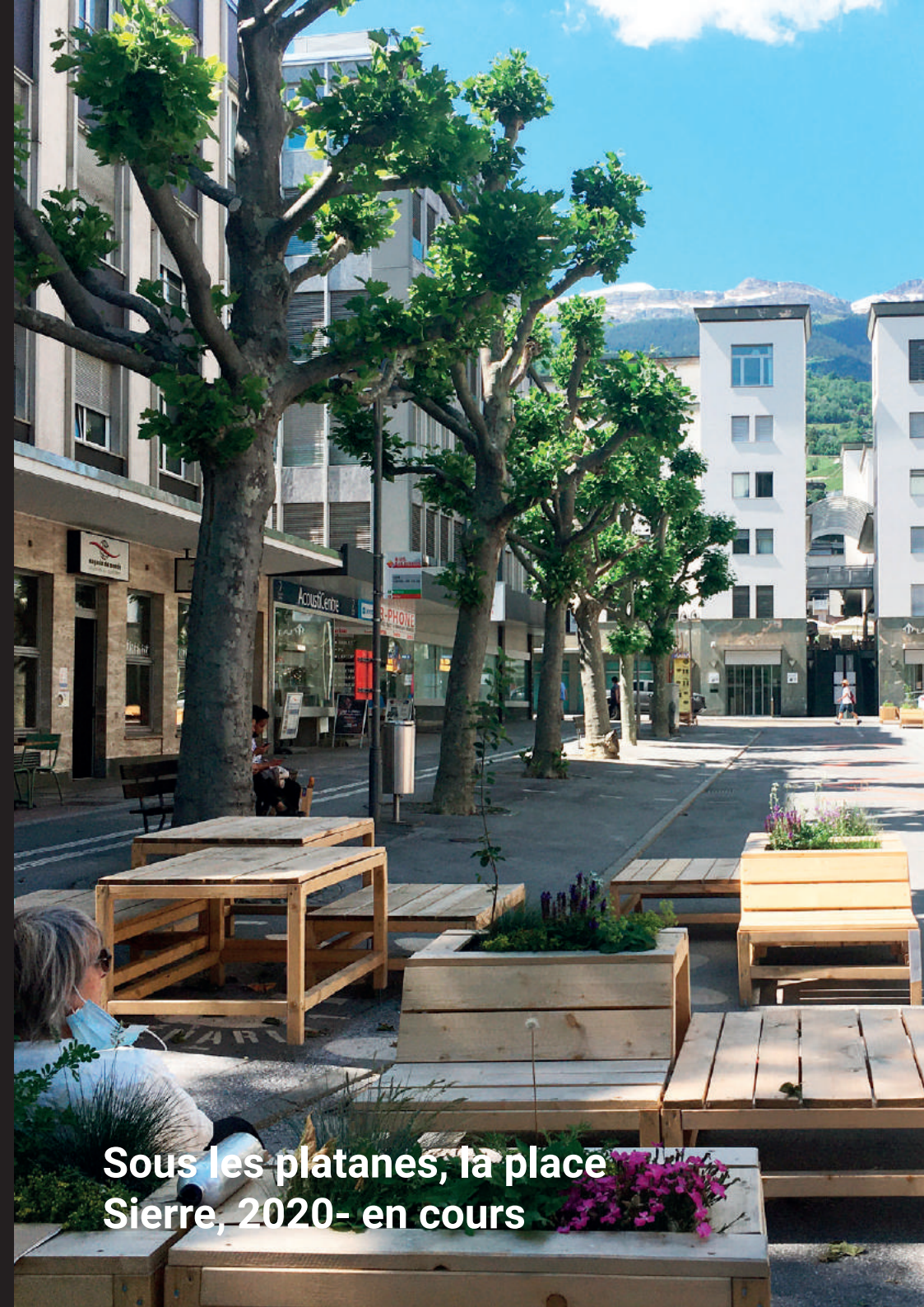
Sous les platanes, la place Sierre, 2020- en cours