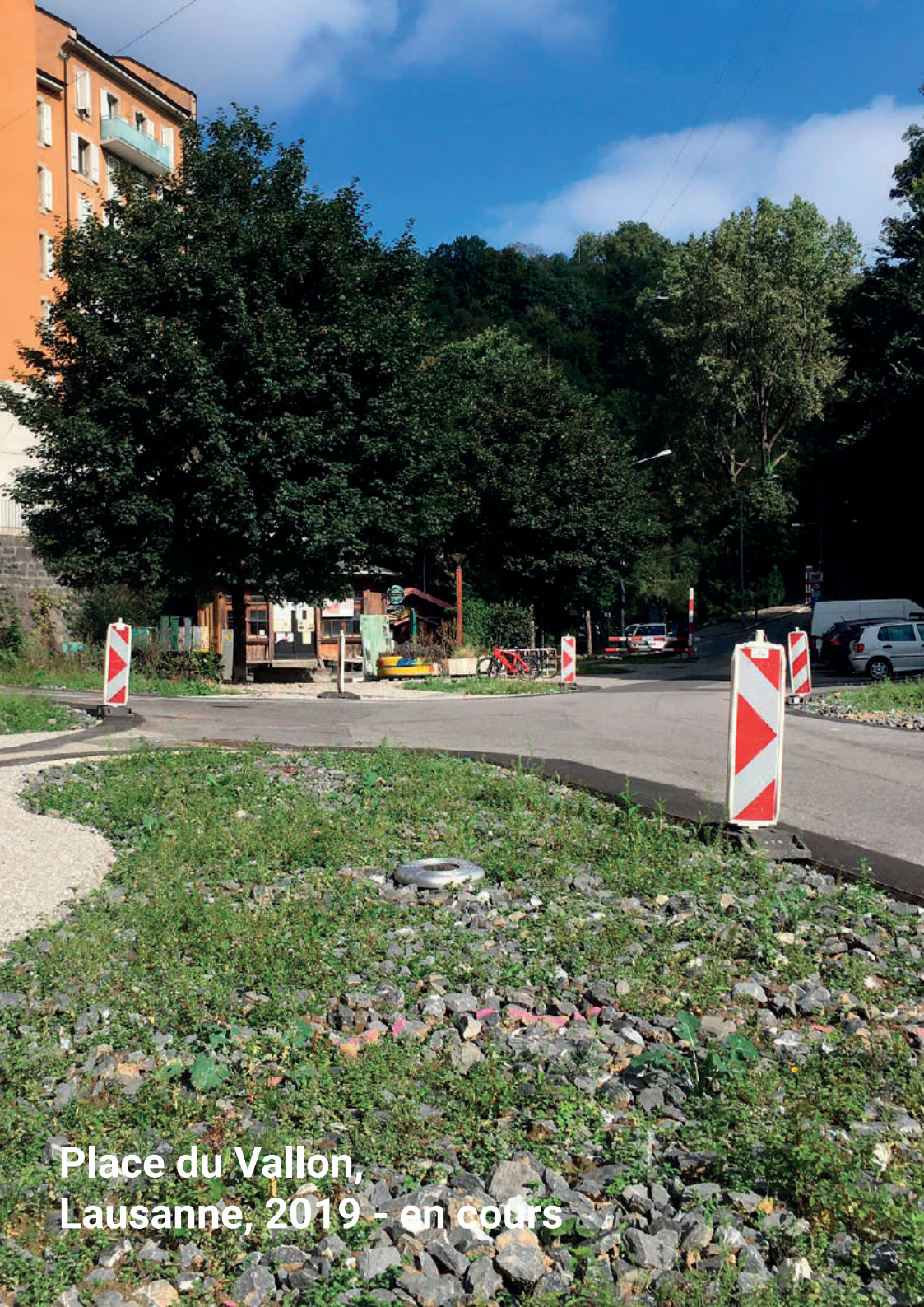
Place du Vallon, Lausanne, 2019 - en cours