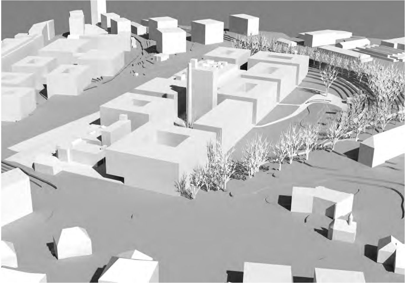
Le projet lauréat du concours d'urbanisme du site blueFACTORY en ville de Fribourg. Das Siegerprojekt des Städtebauwettbewerbs des blueFACTORY-Areals in der Stadt Freiburg.