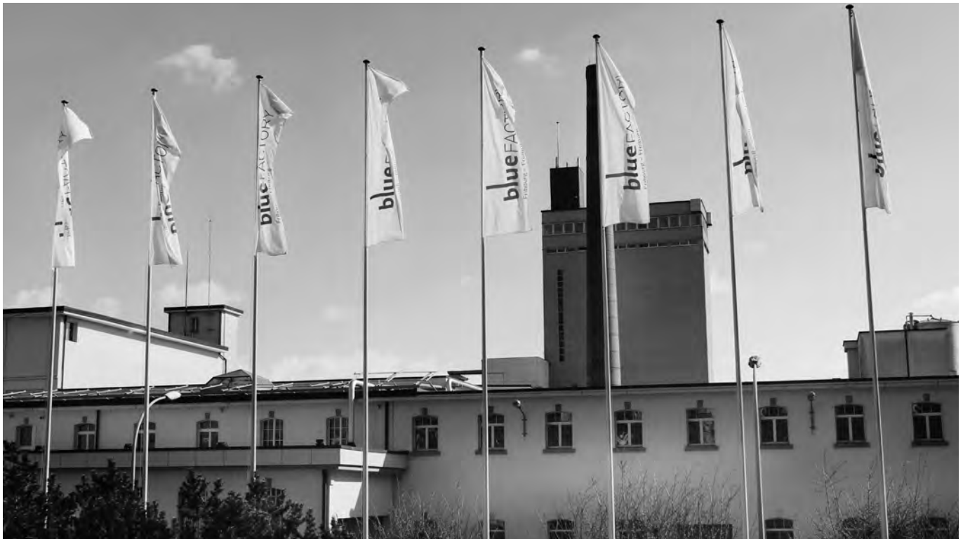
Le site blueFACTORY à Fribourg. Das blueFACTORY-Areal in Freiburg.

Die Risiko Kapital Freiburg AG hat 2012 in zwei neue Unternehmen investiert und ihr Portfolio setzt sich Ende 2012 aus sechs Beteiligungen an Start-up-Firmen des Kantons zusammen. Dank einer kürzlichen Kapitalaufstockung, an der sich auch die Groupe E und die Freiburger Kantonalbank als Aktionäre beteiligt haben, verfügt die Risiko Kapital Freiburg AG heute über ein Kapital von etwa 5 Millionen CHF für ihre Investitionen. Mehrere Dossiers sind in Prüfung und sollten Anfang 2013 umgesetzt werden. Die Risiko Kapital Freiburg AG freut sich, dass die Zahl der Projekte wie auch deren technologische Qualität und ihr Innovationsgrad seit einigen Jahren stetig steigt. Dies beweist, dass die Freiburger Start-up-Vorhaben ständig zunehmen und immer ambitionierter werden.