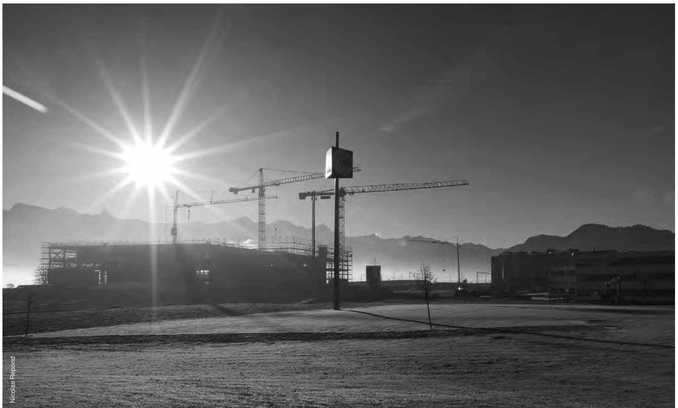
Les travaux de construction du nouveau centre de production biotechnologique d'UCB Farchim à Bulle avancent rapidement. Die Bauarbeiten am neuen Biotechnologiezentrum von UCB Farchim in Bulle kommen rasch voran.