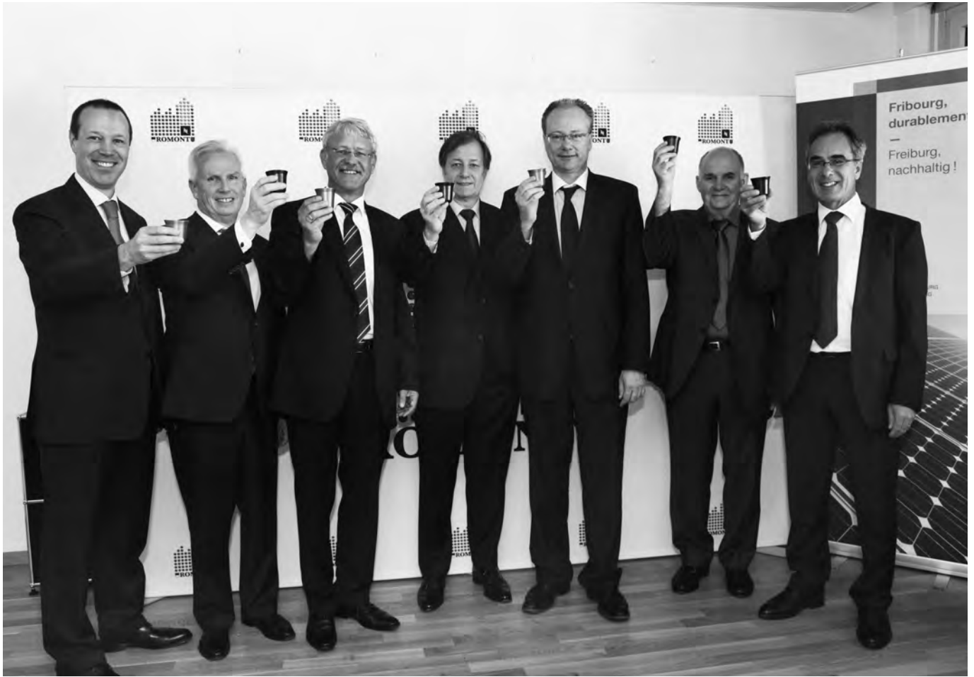
Le management de Nestlé Nespresso trinque au nouveau projet en compagnie des représentants du canton et de la commune. Das Management von Nestlé Nespresso stösst mit den Verantwortlichen von Kanton und Gemeinde auf das neue Projekt an.