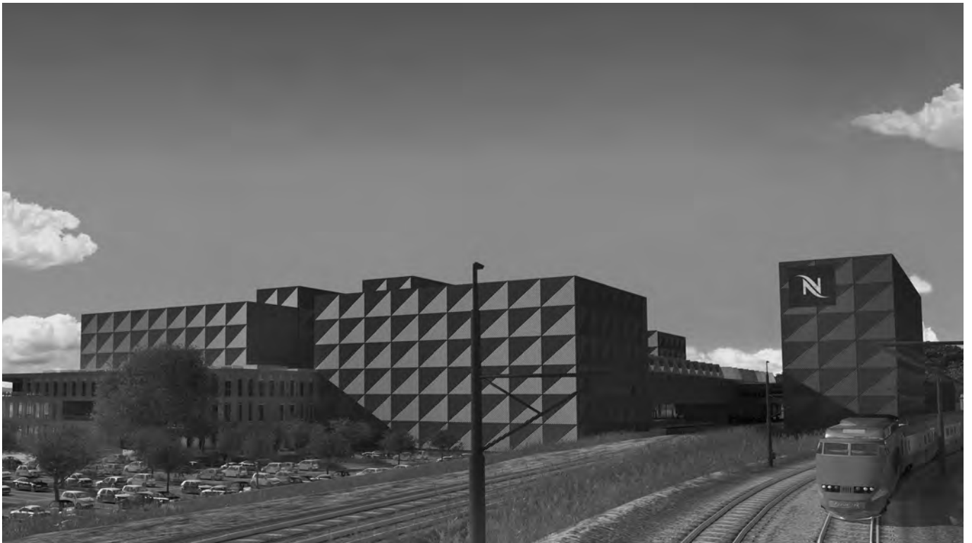
Le site de production de Nespresso à Romont sera raccordé au réseau CFF. Der Produktionsstandort von Nespresso in Romont wird an das SBB-Netz angeschlossen.