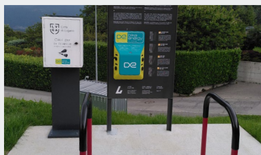
Borne de recharge électrique pour 2 VAE | Lugano Source : Büro für Mobilität SA