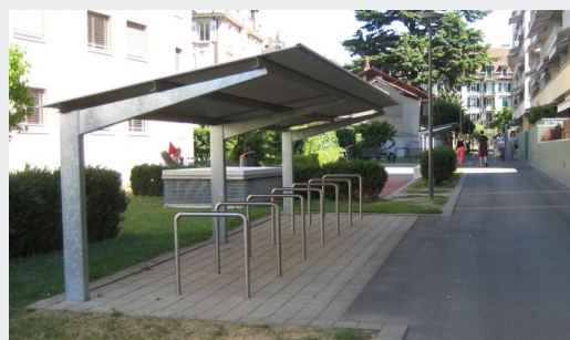
Arceaux fixes (2 places par arceau) | Renens