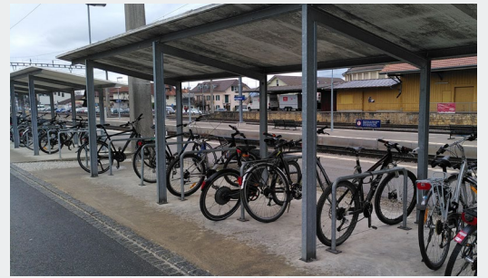
Proximité immédiate du quai ferroviaire | Murten/Morat