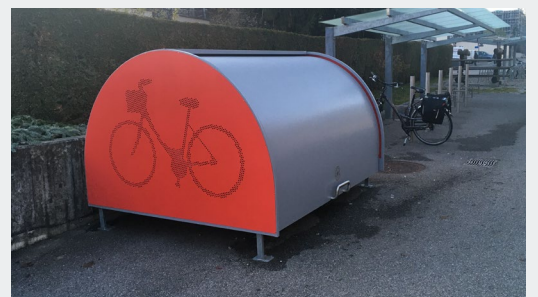
Box à vélos verrouillable | Bulle