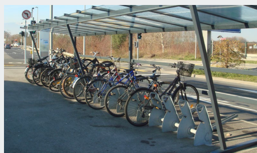
Etrier adapté pour tous type de vélos | Bernex

Des services peuvent être mis à disposition des cyclistes, comme l'installation d'une station de gonflage et de petites réparations, d'une borne de recharge pour vélos à assistance électriques ou de casiers fermés à clé pour déposer des affaires personnelles (casque, pompe, sac à dos, imperméable, lampes à vélo, etc.).