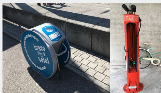
Pompes à vélo en libre-service | Bulle et Berne