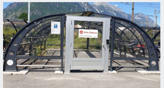
Vélostation verrouillable | Martigny