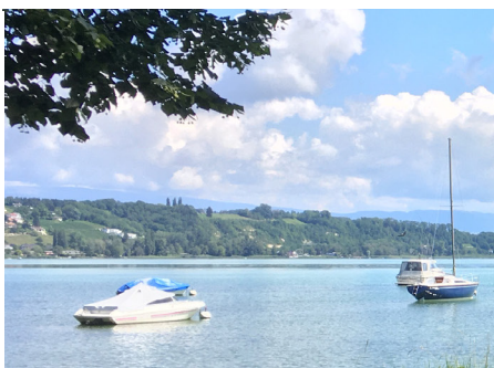
Panorama depuis la plage de Salavaux (n°41, 43)