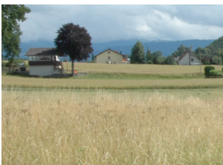
Itinéraire bucolique à proximité de Tavel (point n°36)