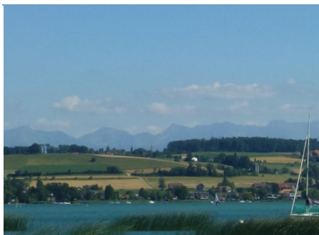
Panorama depuis Sugiez : la plage est idéale pour se baigner et se reposer