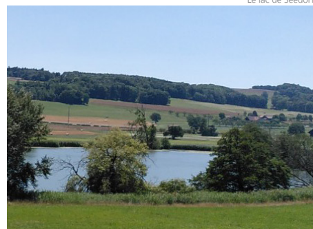
Le lac de Seedorf