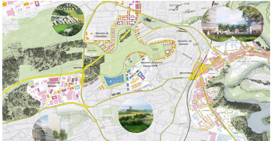
© équipe : Herzog & De Meuron

www.fr.ch/territoire-amenagement-et-constructions/territoire/projet-chamblieux-bertigny-mandats-detude-paralleles