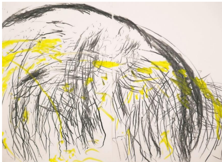
6. Elmar Schafer, Das Tor zum Naturschutzgebiet , 2022.