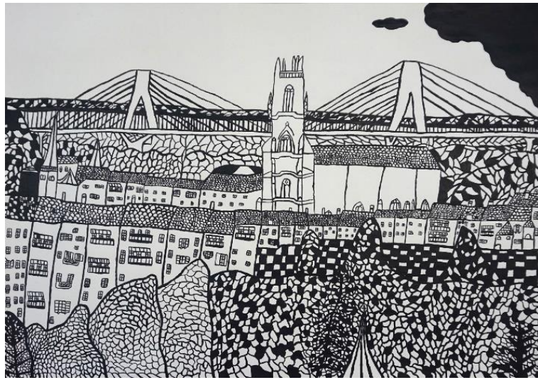
5. Christelle Roulin, Pont de la Poya , 2022. © CREAHM