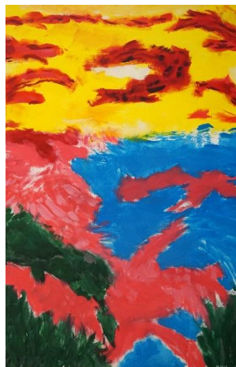
7. Myriam Schoen, Hoffnung, das Leben geniessen zu können , 2023. © CREAHM