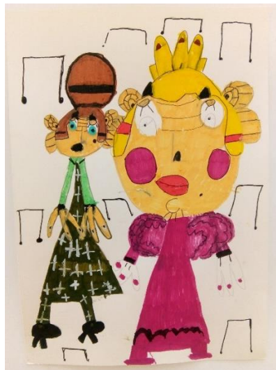
1. Emilie Frosio, Aurore et Reine des Neiges , 2022. © CREAHM