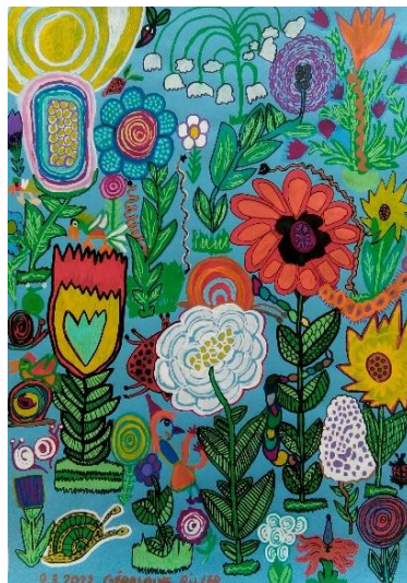
4. Géraldine Piller, Jardin magique , 2022.