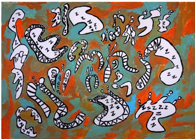
3. Jean-Yves Masset, Confettis 3 , 2021. © CREAHM