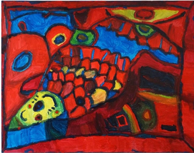
8. Maude Vonlanthen, Poisson-chat , 2021. © CREAHM