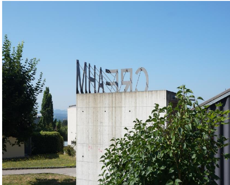
0. Atelier CREAHM, 2022 © CREAHM