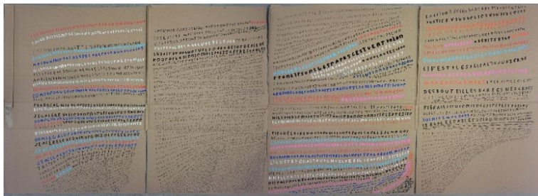
9. Pascal Vonlanthen, Lahanu , 2022. © CREAHM