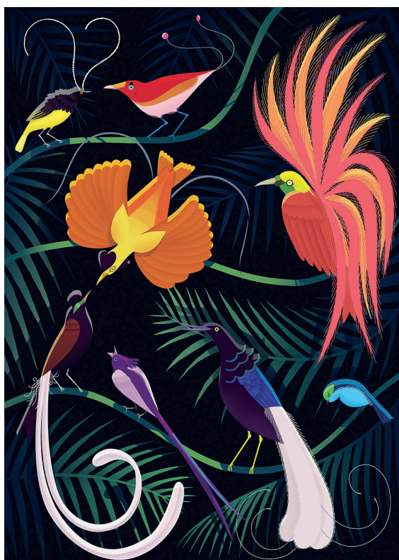
Illustration : Emmanuelle Walker

Durant l'année 2023, le MHNF aura pour fil conducteur la biodiversité. Le coup d'envoi sera donné par l'exposition « Poussins – Curiosum ».