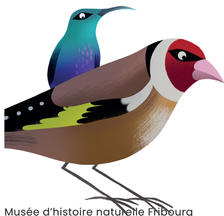
Illustration: Emmanuelle Walker

à Coop Suisse romande pour le don d'oeufs durs colorés pour la chasse aux oeufs du 2 avril.