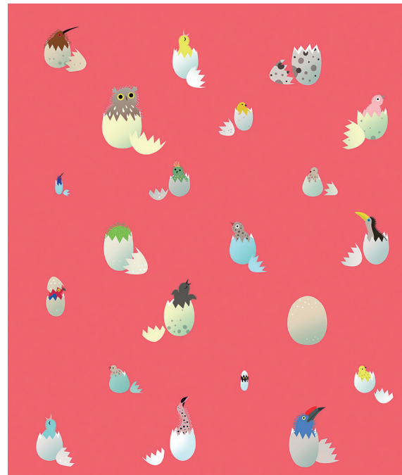
Illustration : Emmanuelle Walker