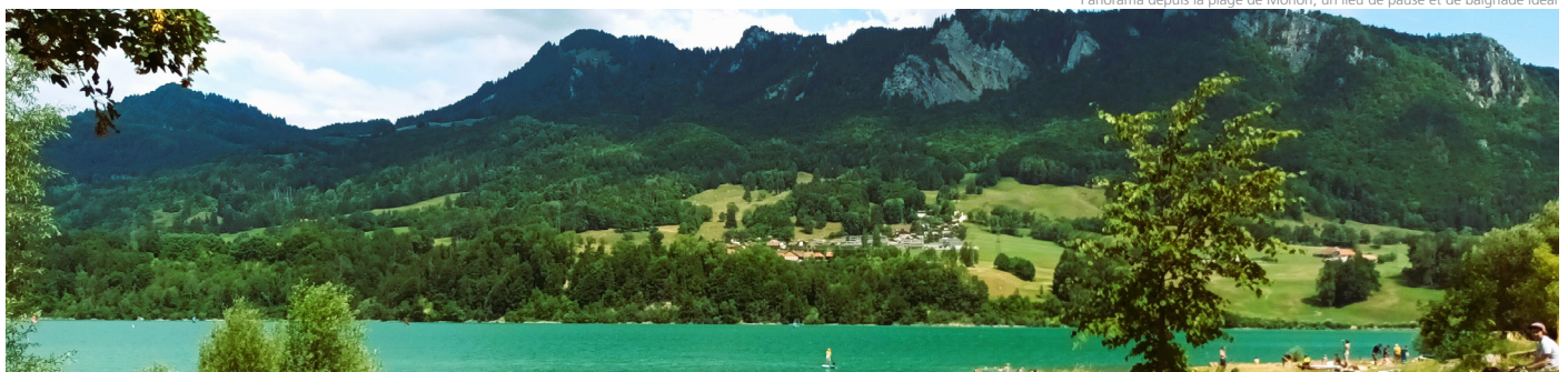
Panorama depuis la plage de Morlon, un lieu de pause et de baignade idéal