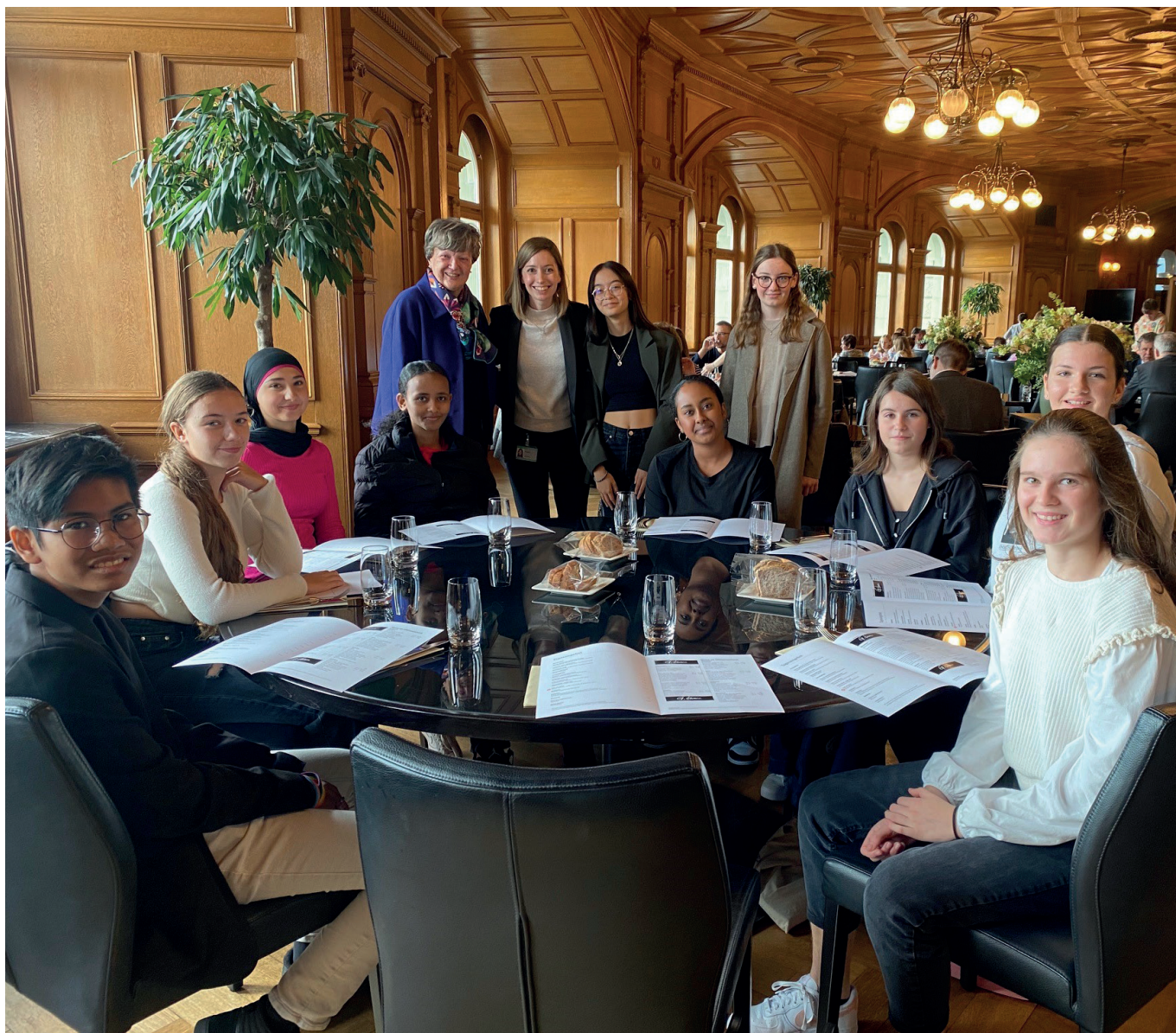
Foto der Gruppen, die Isabelle Chassot und Johanna Gapany am 10. November 2022 begleiteten.