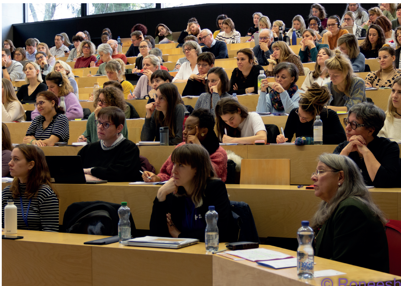
Die Teilnehmerinnen und Teilnehmer vom 18.11.2022.