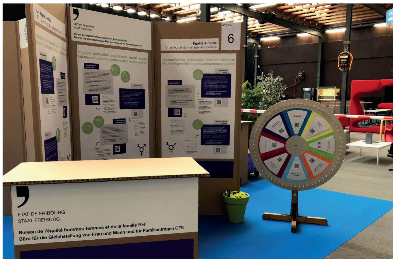
Stand des GFB am «Salon de l'Entreprise» im März 2022.

Eine Informationsbroschüre für Privatunternehmen ist in Erarbeitung und wird 2023 veröffentlicht. Die Website des GFB listet alle Unterlagen zu diesem Thema auf und hat im Oktober 2022 den ersten Newsletter zum Thema Gleichstellung im Unternehmen lanciert (Anmeldung auf der GFB-Website).