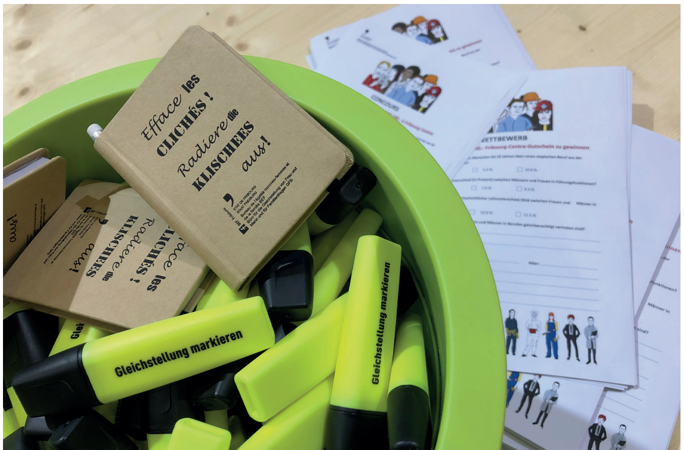
Wettbewerbe und Geschenke des Stand des GFB am START! Forum der Berufe im Februar 2022.