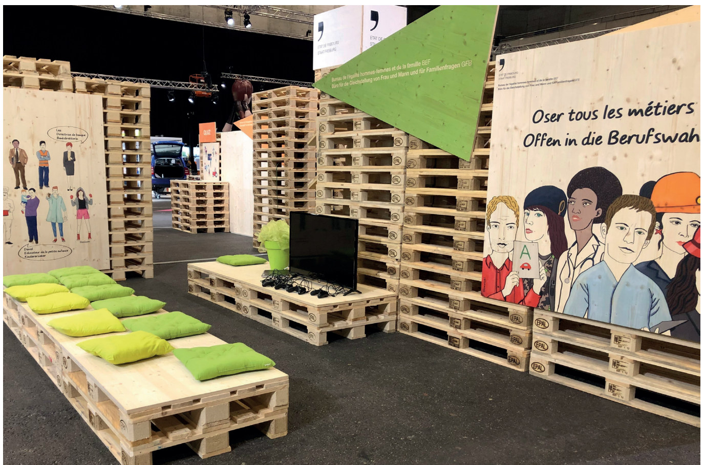
Stand du BEF à START! Forum des métiers.