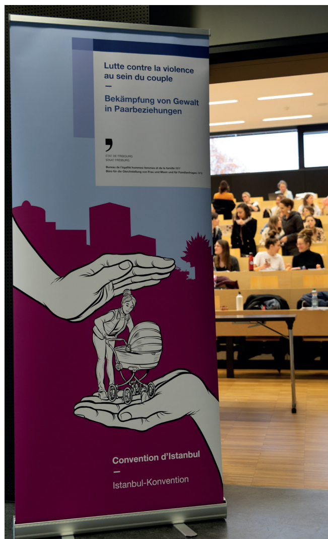
Eingang zur Aula G140 im Gebäude Pérolles (PER 21) der Universität Freiburg am 18.11.2022.