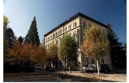
Le Musée d'histoire naturelle de Fribourg

Bientôt tu te rendras au Musée d'histoire naturelle de Fribourg pour visiter l'exposition «La terre à bout de souffle». Mais sais-tu ce qui est conservé en général dans un Musée d'histoire naturelle ? Et quelles sont les missions d'un tel établissement ? Cite ci-dessous 4 objets que tu pourrais y trouver et 3 missions que tu penses qu'un musée doit réaliser.