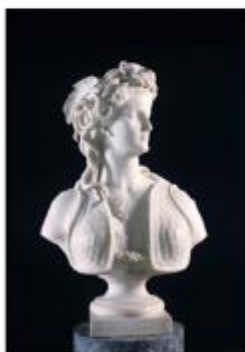
La Gorgone (1865), Marcello