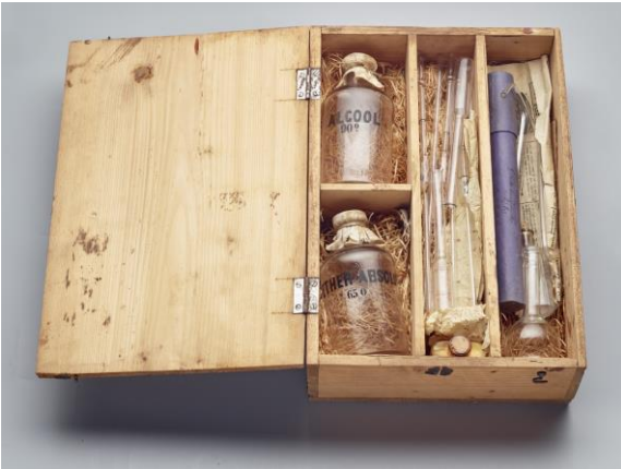
Daler & co, Lactobutyromètre, fin du 19 e siècle