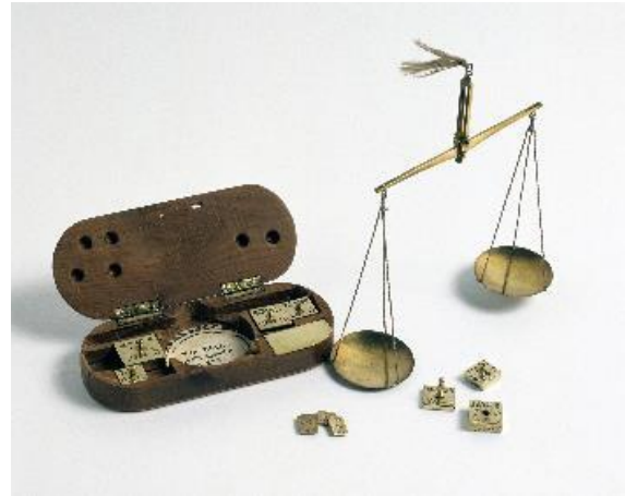
Peter Blatter, Balance à monnaies, vers 1800