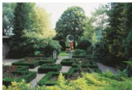
Vue du jardin à la française, avec La Grande Lune (1985/1992), Niki de Saint Phalle

Les jardins du MAHF servent d'écrin à des sculptures monumentales.