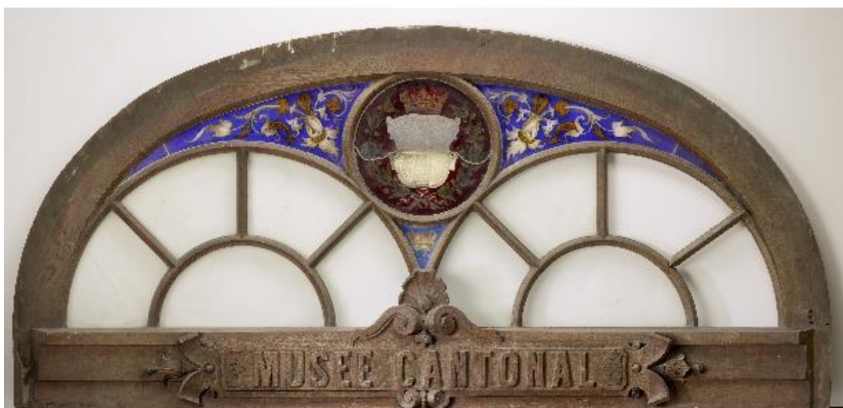
Vitrail du fronton ou de l'imposte de l'entrée du Musée cantonal au Lycée, 1873

Le musée traverse les époques. Il a maintenant 200 ans. Comment doit-il poursuivre son voyage ? Un voyage oscillant entre un lieu de science et un lieu d'ouverture sur des mondes imaginaires ? Doit-il suivre les tendances et les modes pour survivre ? Comment doit-il réagir aux changements sociologiques et technologiques ? Comment doit-il se saisir des expériences collectives et individuelles ? Quels souvenirs, quels savoirs, quelles cultures pourra-t-il encore transmettre à l'avenir ?