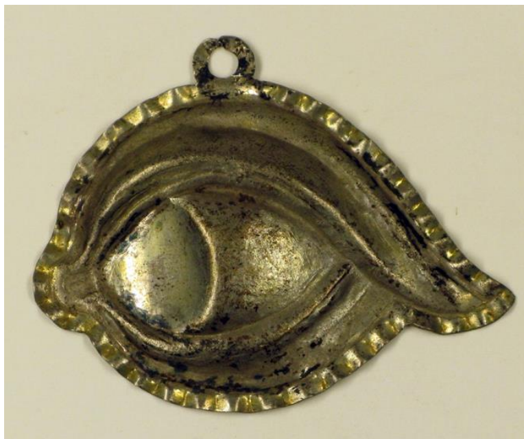
Ex-voto, fin du 19 e siècle

Les élèves réalisent une création collective sur la base de photographies des pièces de ce fabuleux cabinet de curiosités.