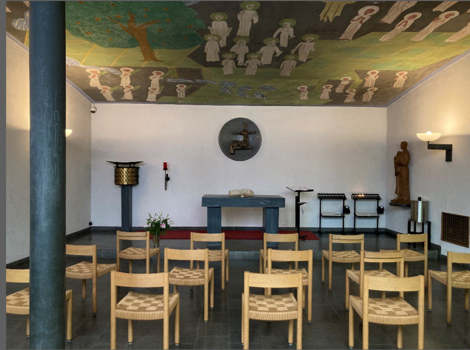
Luzern, Maihofkirche (St. Josef), erweiterte Nutzung als Der MaiHof seit 2013, Kirche bleibt Eigentümerin, Vermietungen, kirchliche, kulturelle und soziale Nutzung.