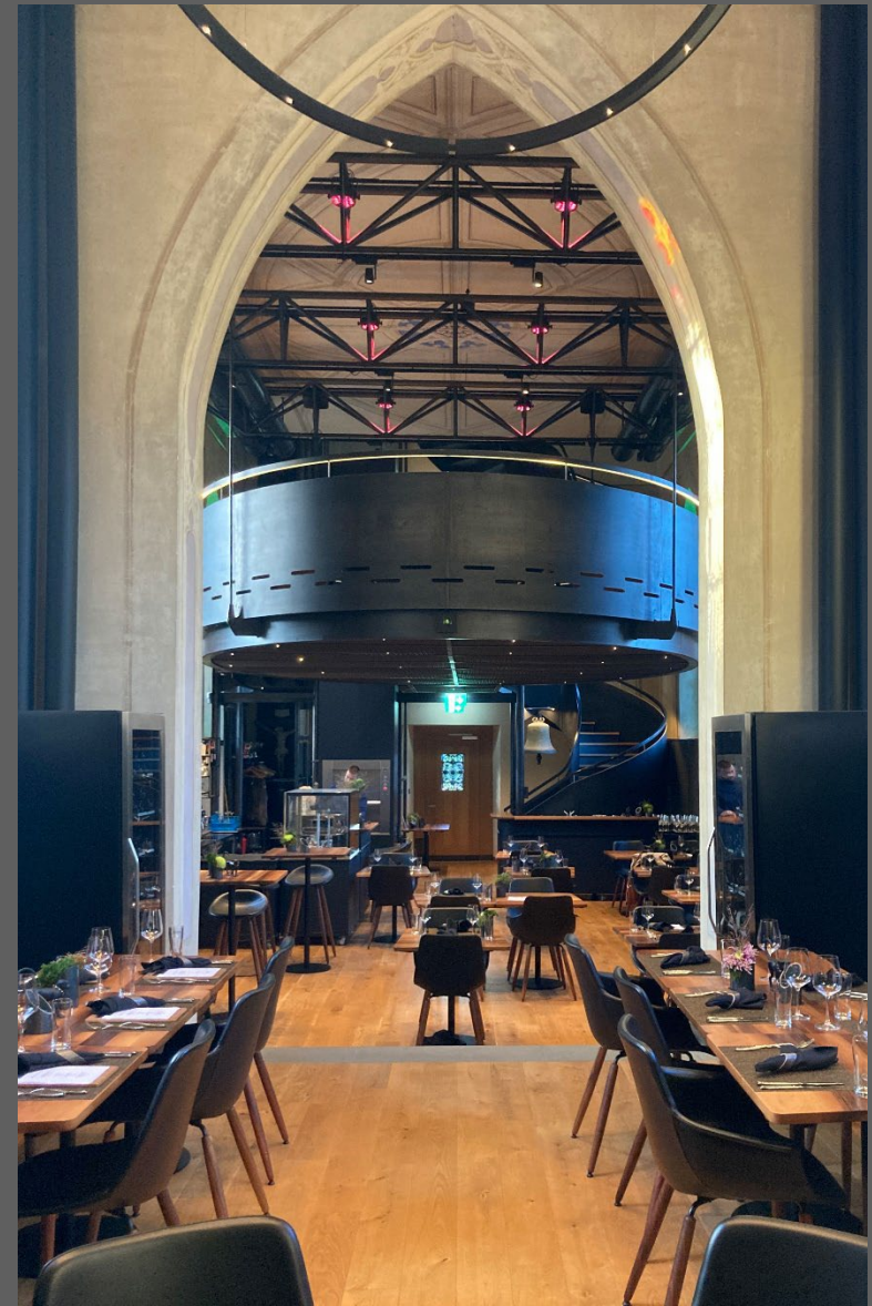
Dierikon, Dorfkapelle, Verkauf 2018 an Privat, Neunutzung als Restaurant