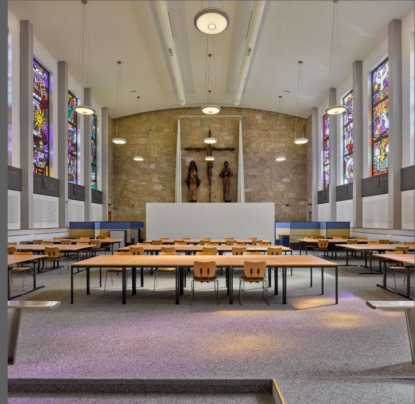
Fribourg, Regina Mundi, Verkauf 1990 an Kanton, Neunutzung als Studier- und Arbeitsaal der Universität Fribourg