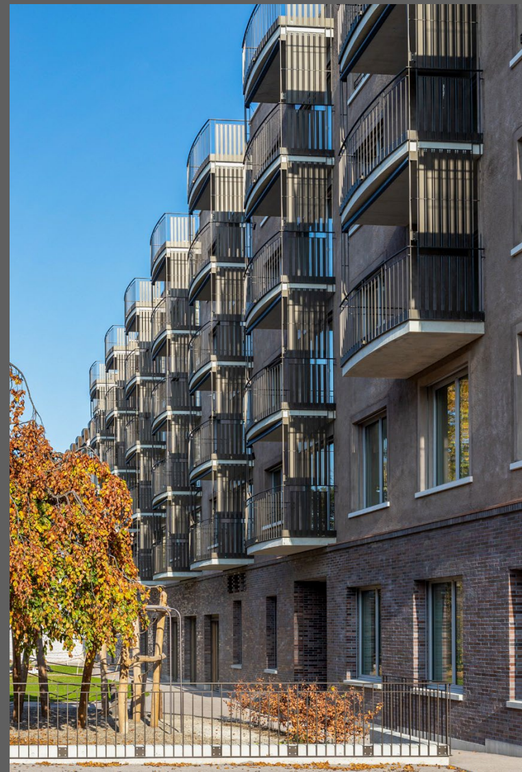
Basel, Kirchenzentrum St. Christophorus, Abriss und Neubau 2020 durch Römisch-Katholische Kirche Basel-Stadt, Nutzung: Kirche, Kindergärten, Wohnungen.