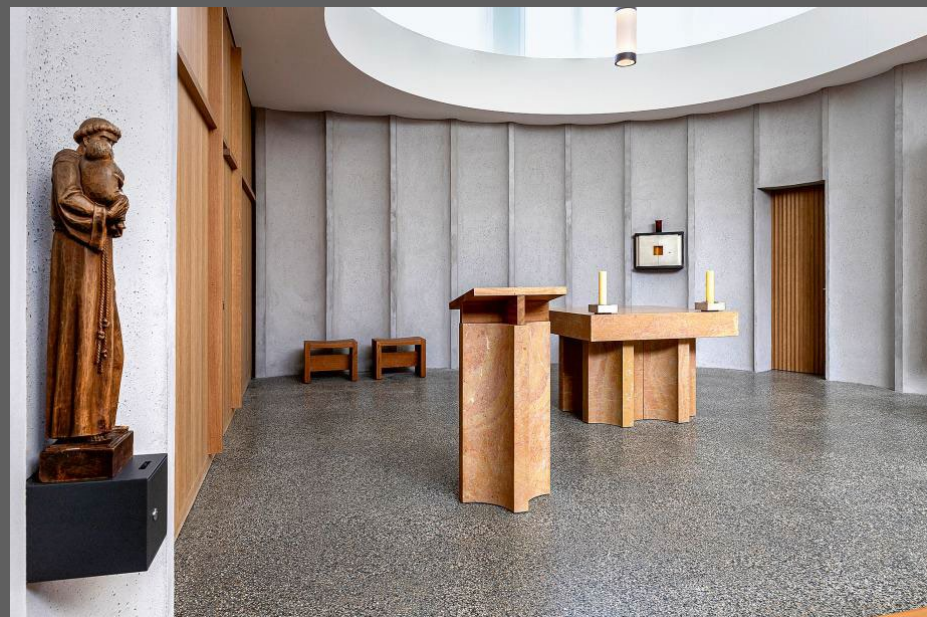
Basel, Kirchenzentrum St. Christophorus, Abriss und Neubau 2020 durch Römisch-Katholische Kirche Basel-Stadt, Nutzung: Kirche, Kindergärten, Wohnungen.