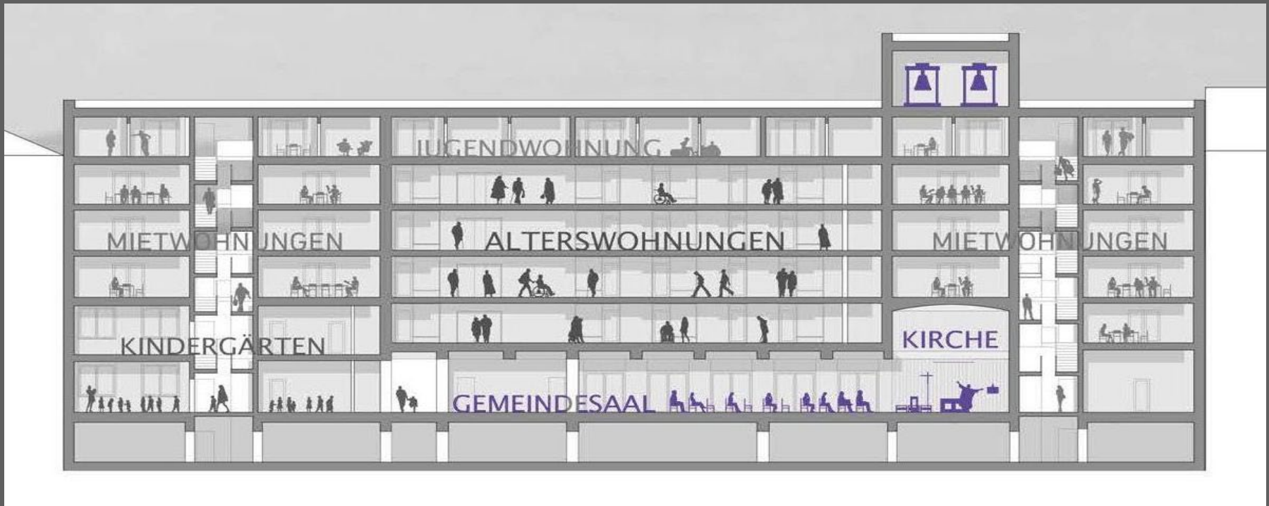
Basel, Kirchenzentrum St. Christophorus, Abriss und Neubau 2020 durch Römisch-Katholische Kirche Basel-Stadt, Nutzung: Kirche, Kindergärten, Wohnungen.