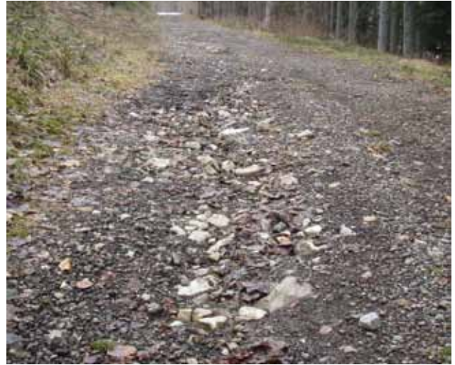
Photo : fraisats laminés et emportés par l'eau dans la forêt