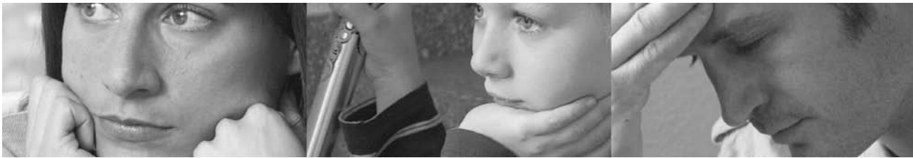
Violence domestique – Feuille d'information

lentes. D'autres en appellent à l'amour et au sens des responsabilités de la victime et promettent de s'amender. Dans l'espoir que leur partenaire va vraiment changer, beaucoup de victimes retirent alors leur demande de séparation ou reviennent sur les déclarations qu'elles ont faites, p. ex. dans le cadre d'une procédure pénale. Nombre de personnes concernées interrompent les consultations qu'elles avaient commencées ou des femmes quittent la maison d'accueil où elles avaient trouvé refuge pour réintégrer le domicile. Les victimes refoulent le souvenir des mauvais traitements, défendent leur auteur·e contre les personnes extérieures et minimisent la violence subie.