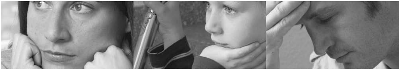
Violence domestique – Feuille d'information

texte de maltraitance, à une violence psychique grave et souvent aussi sexuelle. C'est pourquoi les spécialistes concernés doivent impérativement tenir compte, dans des cas de cette nature, du contexte global de la violence systématique et continue. Ces configurations commandent de prendre spécialement au sérieux la menace du recours à la violence en cas de séparation (BMFSFJ 2012).