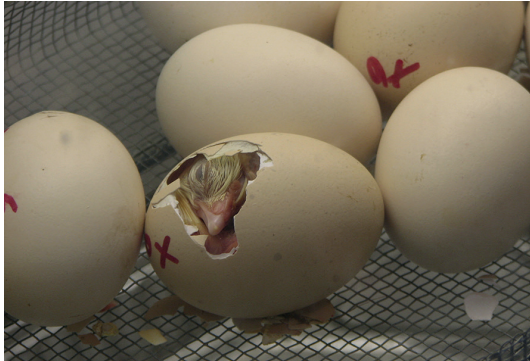
4 - Eclosion