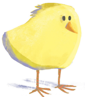
8 - Visuel 2017 © Emma Wicht