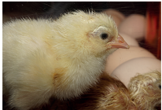
7 - 1 jour