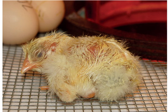
5 - Reprendre des forces