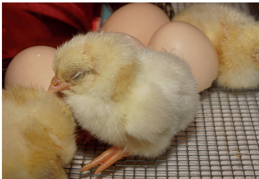
6 - Sieste