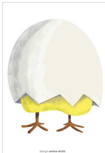
2 - Visuel 2017 © Emma Wicht