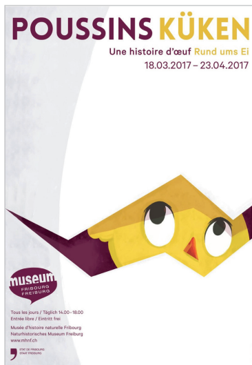
1 - Affiche 2017 © Emma Wicht