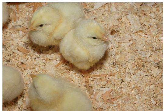
9 - Dans la poussinière