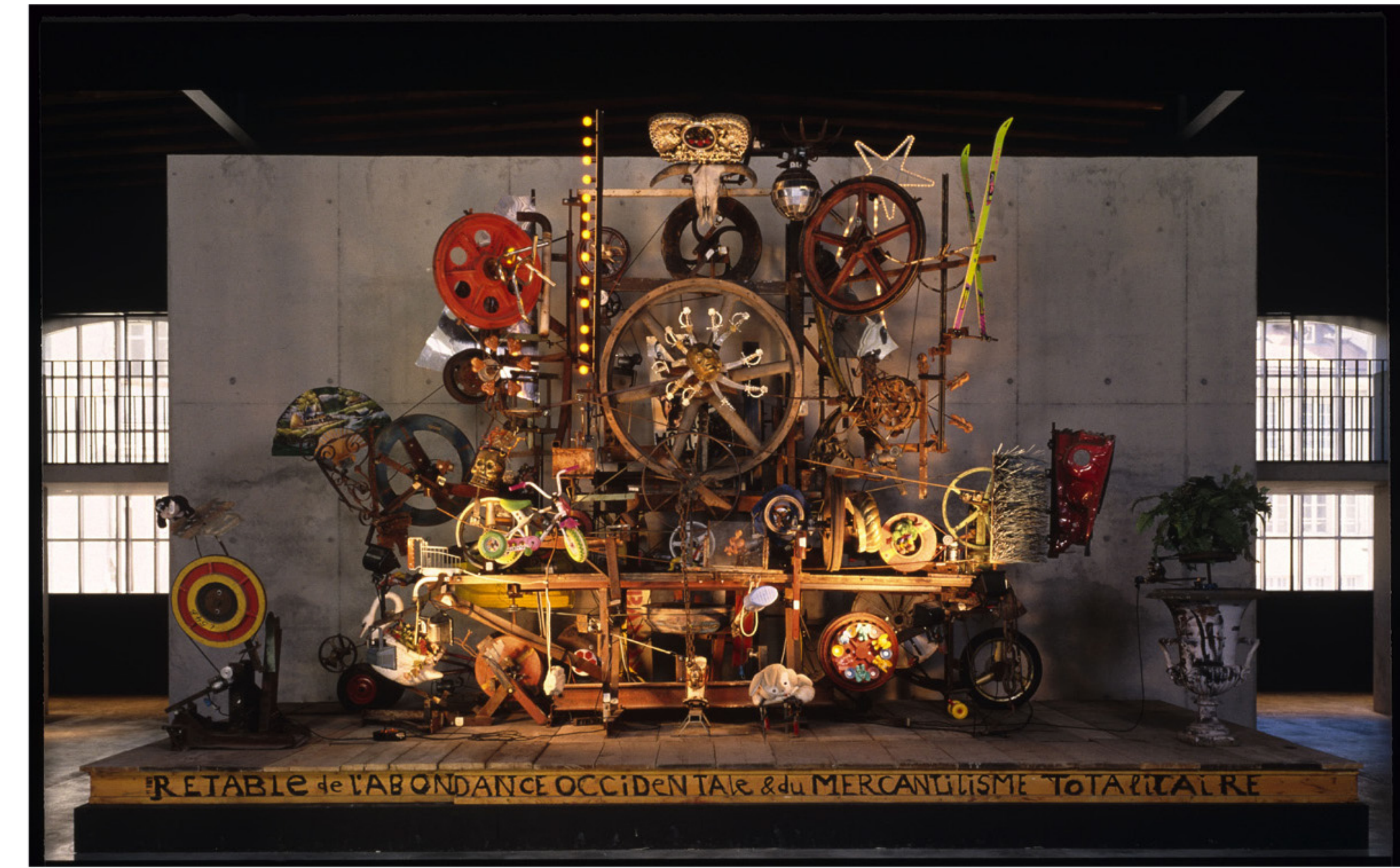
Retable de l'Abondance occidentale et du Mercantilisme totalitaire