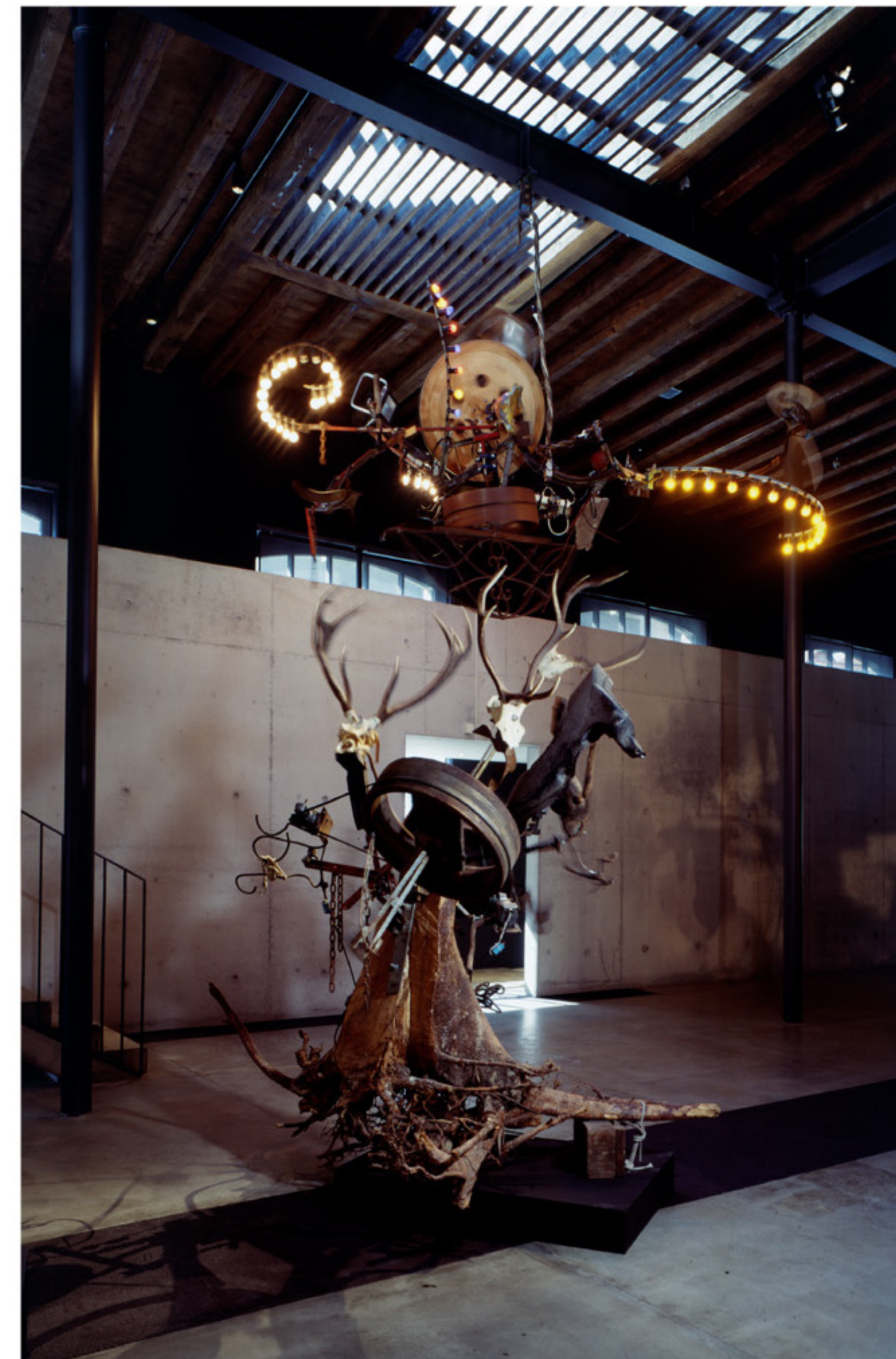
(La) Cascade ou (l')Epilepsie stabilisée