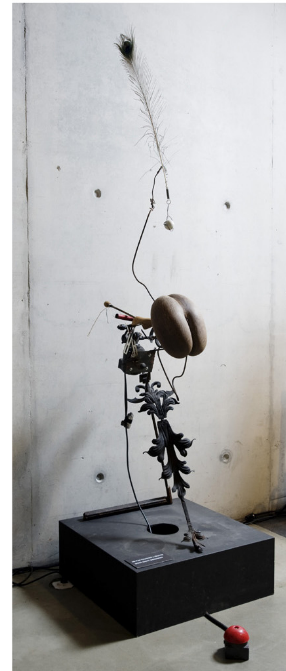
Hommage à Bernard Blancpain