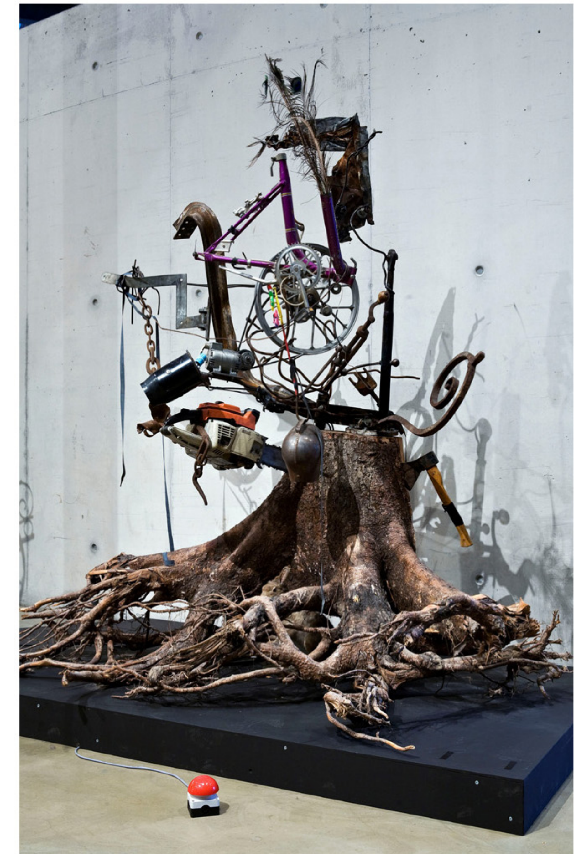
La nature apprivoisée

ESPACE JEAN TINGUELY NIKI DE SAINT PHALLE