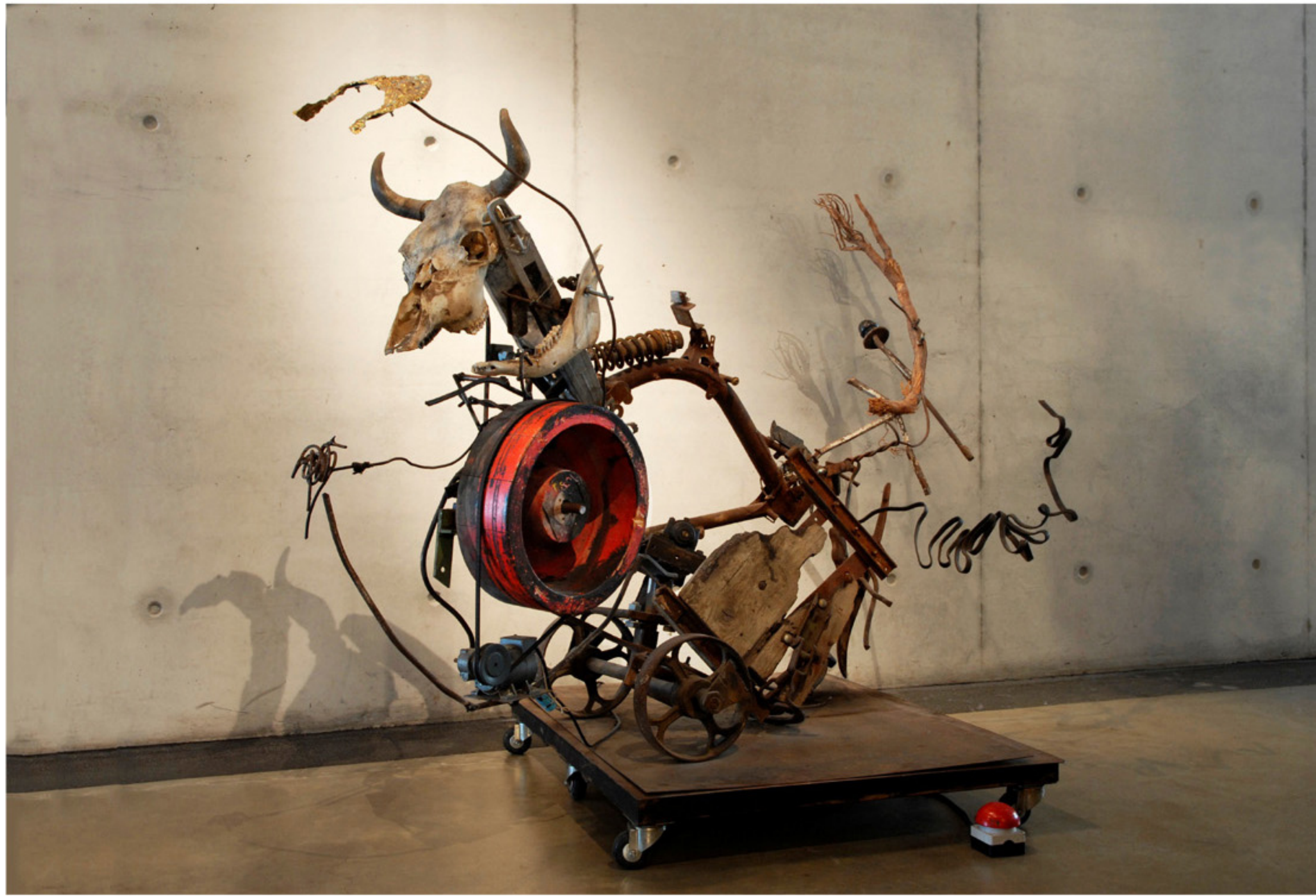
La vache qui rit

Jeu: reconnaissance sonore - Ecoute les bruits et retrouve par quelle machine ils sont produits.