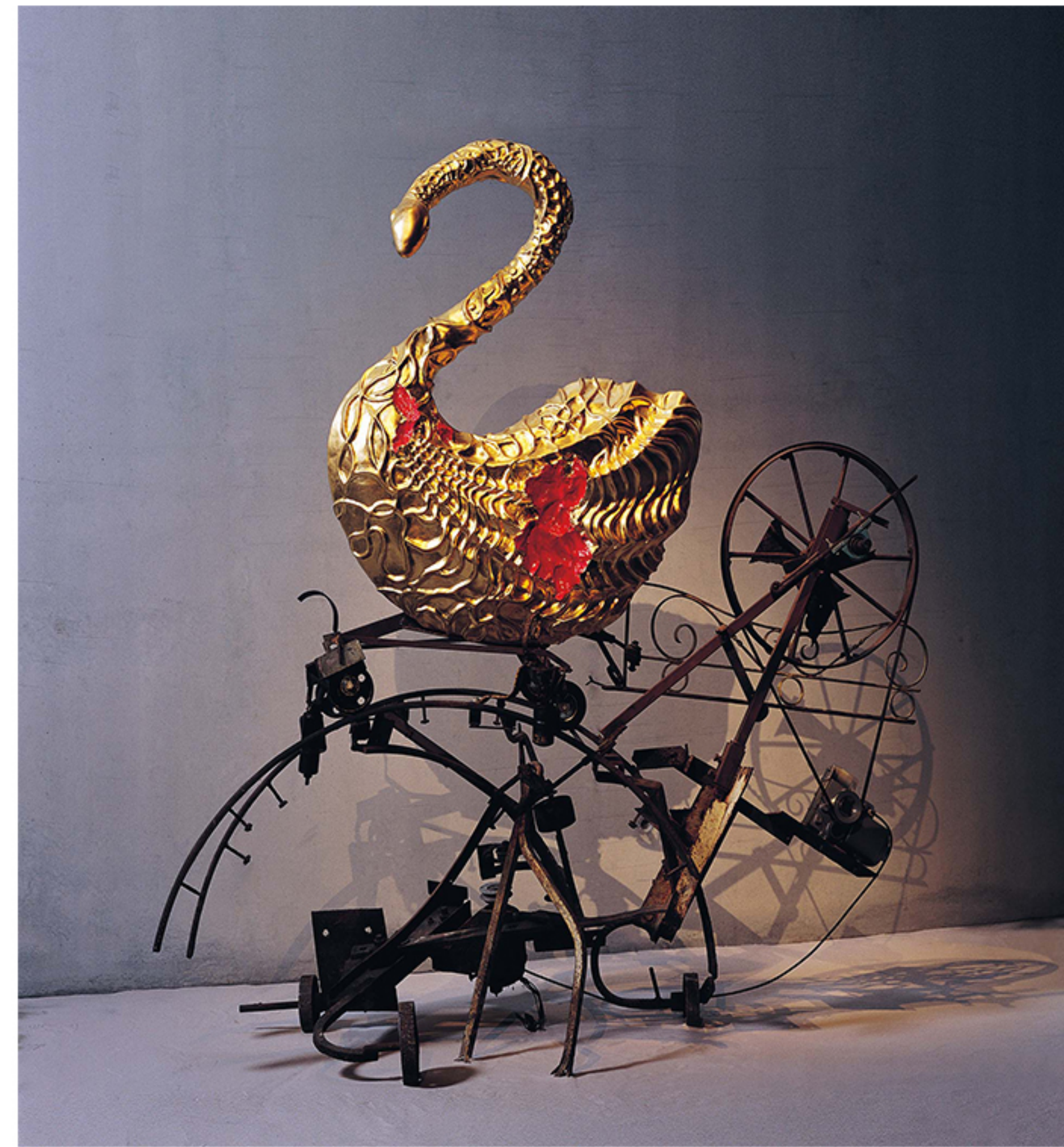
La Mythologie blessée