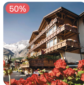
★★★★★ Walliserhof Grand-Hotel & Spa Saas-Fee