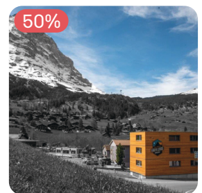
★★★★★ Eiger Lodge Grindelwald