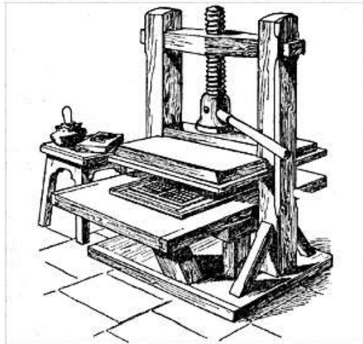
La presse de Gutenberg

Combien y a-t-il encore de lettres après celle-ci dans l'alphabet ?