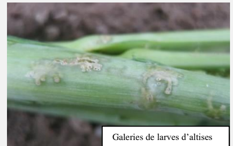
Galleries de larves d'altises

Il s'agira d'évaluer vers la fin octobre si une intervention est nécessaire. Les larves sont réellement nuisibles que si le cœur des colzas est touché. En principe, le risque est réduit si les colzas sont bien développés à l'entrée de l'hiver (min. 10 feuilles et 8 mm de diamètre au collet) et sains (racines sans hernie du chou). Sur ces colzas vigoureux, les larves peuvent terminer leur cycle dans les pétioles des feuilles, sans aller jusqu'au cœur. Mais un hiver doux peut accentuer les dégâts. Grâce à l'extraordinaire capacité de compensation du colza, l'impact sur le rendement des dégâts d'altises est souvent plus faible qu'escompté.