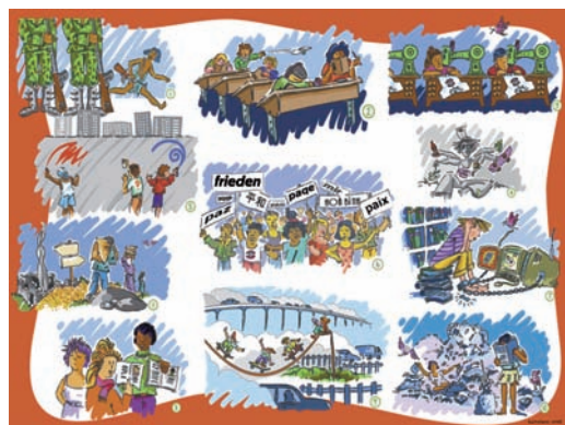
11 situations d'enfants. 10-13 ans. Gratuit, disponible à un exemplaire par élève, frais de port en sus

Ce poster au format A3 présente onze situations d'enfants dans le monde. Celles-ci permettent aux enfants de s'exprimer sur les droits et de faire des liens avec leur quotidien. Sept activités sont proposées pour exploiter ce document.