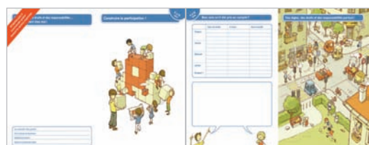
Construire la participation. 9-12 ans. Gratuit, disponible à un exemplaire par élève, frais de port en sus

Cette fiche sert de base à une réflexion sur la construction, ensemble, d'une société démocratique. L'élève tisse des liens entre les droits de l'enfant, la vie en société et son propre vécu. Des activités sont proposées pour utiliser les différentes pages du document. Vous les trouvez sous www.globaleducation.ch , rubrique Matériel pédagogique / Dossiers en ligne / Droits de l'enfant .