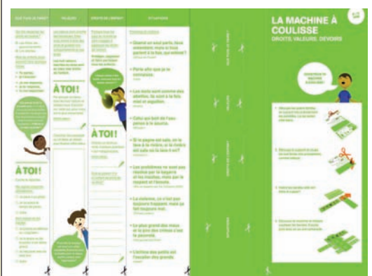
Machine à coulisse. 8-11 ans. Gratuit, disponible à un exemplaire par élève, frais de port en sus

La machine à coulisse a été largement utilisée auprès des élèves 8 à 11 ans. Vous trouvez sous www.globaleducation.ch , rubrique Matériel pédagogique / Dossiers en ligne / Droits de l'enfant des activités permettant d'exploiter ce document. Elles permettent à l'élève de comprendre que plusieurs acteurs sont impliqués dans le respect des droits de l'enfant (l'Etat, la famille, l'enfant lui-même, la société) et de mettre en regard les droits et les valeurs.