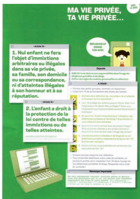
Ma vie privée, ta vie privée. Dès 12 ans. Gratuit, disponible à un exemplaire par élève, frais de port en sus

Les élèves sont invités à étudier les droits de l'enfant au travers d'événements d'actualité et des médias: Internet, blogs et téléphones portables. Des propositions d'activités sont à disposition sous www.globaleducation.ch , rubrique Matériel pédagogique / Dossiers en ligne / Droits de l'enfant .