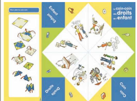
Coin-coin des droits de l'enfant. 4-8 ans. Gratuit, disponible à un exemplaire par élève, frais de port en sus

A l'aide de ce support, les élèves prennent connaissance de différents aspects des droits de l'enfant: réciprocité droit/devoir, ce que les enfants peuvent faire à leur niveau, universalité des droits. Plusieurs activités pour exploiter ce document se trouvent sous www.globaleducation.ch , rubrique Matériel pédagogique / Dossiers en ligne / Droits de l'enfant .