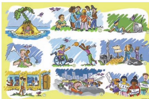
9 situations d'enfants. 5-9 ans. Gratuit, disponible à un exemplaire par élève, frais de port en sus

Ce poster au format A3 présente neuf situations d'enfants dans le monde. Celles-ci permettent aux enfants de s'exprimer sur les droits et de faire des liens avec leur quotidien. Six activités sont proposées pour exploiter ce document.