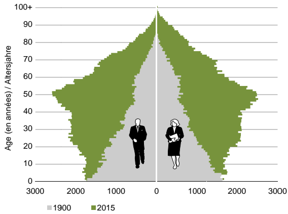
Pyramide des âges 1 , en 1900 et 2015 Alterspyramide 1 1900 und 2015